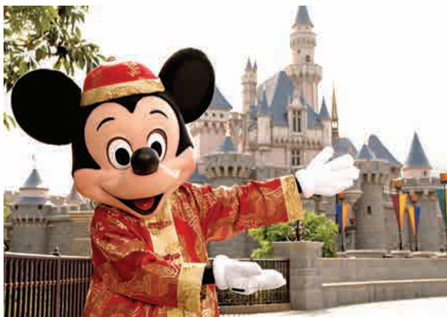
▲上海迪士尼樂園即將開幕，香港旅遊業能否保住現有優勢，亦已到了關鍵的「大考」期

為什麼訪港旅客會下跌？客觀而言，當中既有外部因素亦有內部因素。從外部因素來說，首先，內地客是訪港遊客極主要的一環，但目前世界各地都