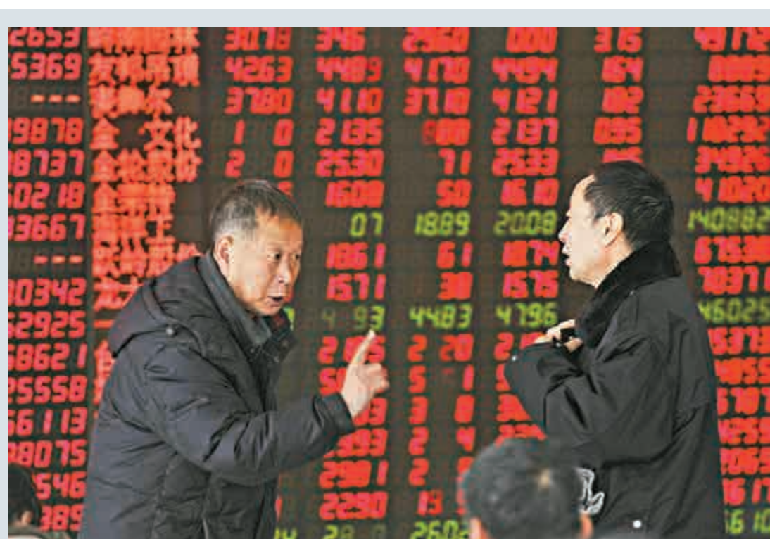
▲滬深兩市昨日跳空低開，滬指早盤下探至2867.55點後反彈，午後兩市繼續走高，滬指尾盤再發力，收復3000點

華融證券續稱，不否認經過前期暴跌之後，市場估值已趨於合理，底部正在趨近。但即便後期利好政策出台，市場大概率是U型走勢，而非V型走勢，這也決定了操作方式。建議投資者短期不急於布局，交易有時是操作，有時是等待，不妨等市場底部平台穩固後再擇機選擇優質個股。