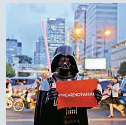
▲一名男子15日扮成《星戰》角色黑武士手舉「我們不怕」標語站在雅加達街頭

印尼警方發言人表示，在西爪哇省德波，警方反恐種部隊88特別分隊當天黎明前發動突襲行動，逮捕這3名印尼人。這3名嫌犯來自與印尼籍「伊斯蘭國」(ISIS)成員耐米有關的恐怖組織。耐米據信目前人在敘利亞城市拉卡。警方認為他是雅加達恐襲的幕後策劃者。