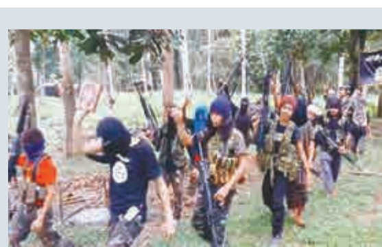
▲ISIS去年發布影片顯示在菲律賓南部森林建立軍事訓練營