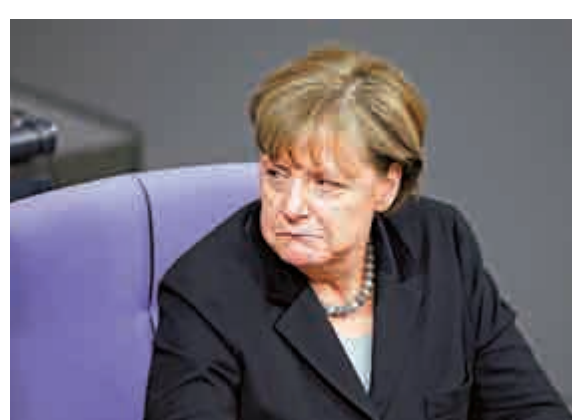
▲德國總理默克爾13日在柏林出席議會會議

用一個新的、更細微的風險管理框架應對。馬森表示，此後的公共活動，例如足球比賽，將會採取加強安全措施的做法，而非直接取消。