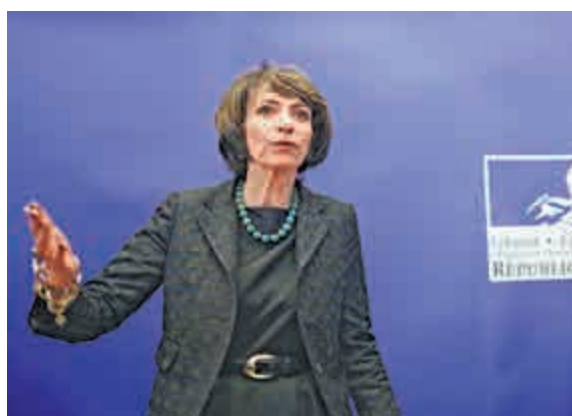
▲法國衛生部長圖雷納15日召開記者會宣布藥物臨床實驗發生事故

每年都有數千名志願參與這類被視為安全的臨床試驗。參與者往往都是賺外快的學生。不幸的情況相對罕見。但在2006年，有6名男性參與了一次對抗自體免疫病及白血病的藥物的臨床試驗，結果要在倫敦入院。