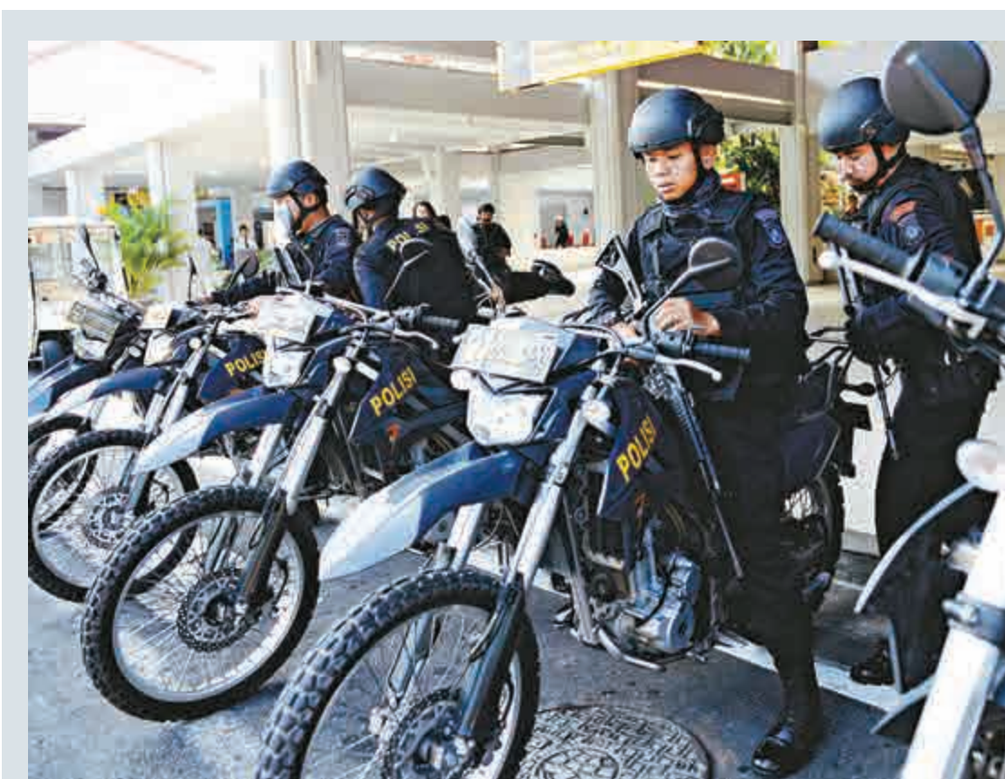
▲印尼特警15日準備在峇里島機場巡邏

雅加達遭遇恐襲後，印尼鄰國馬來西亞及菲律賓隨即提高境內的防恐戒備。不過，馬菲兩國警方都表示，至今沒有明確情報顯示兩國面對恐怖襲擊的威脅。菲律賓總統阿基諾三世15日也出面「消毒」稱，菲國沒有「可信」威脅，但有「一般」威脅。