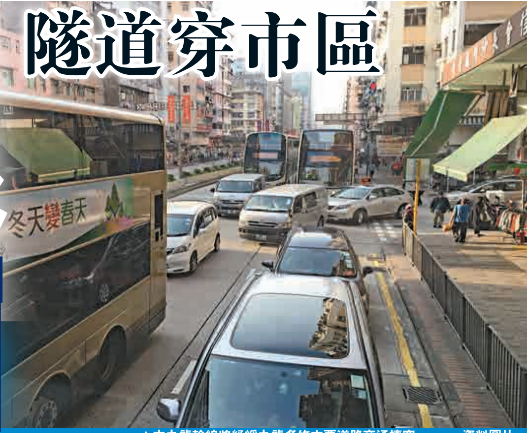
▲中九龍幹線將紓緩九龍多條主要道路交通擠塞 資料圖片