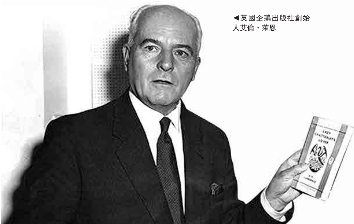
▲英國企鵝出版社創始人艾倫·萊恩