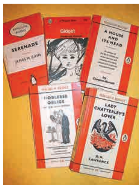
▲企鵝早期出版的部分書籍