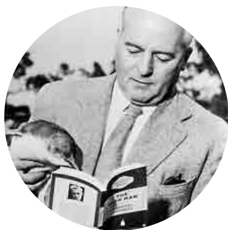
▲英國企鵝出版社創始人艾倫·萊恩