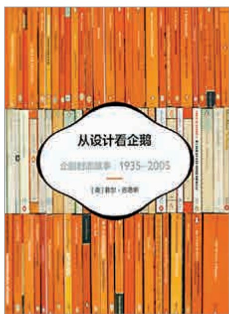
▲《從設計看企鵝》簡體中文版二〇一五年八月由人民美術出版社出版

《從設計看企鵝》的作者菲爾·巴恩斯一九五八年生於英國威斯特莫蘭郡，一九八五年畢業於聖馬丁藝術學院，一九九一年至今在中央馬丁藝術與設計學院任高級講師。