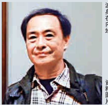
▲廣東省公安廳昨日覆警方，證實李波身在內地 資料圖片