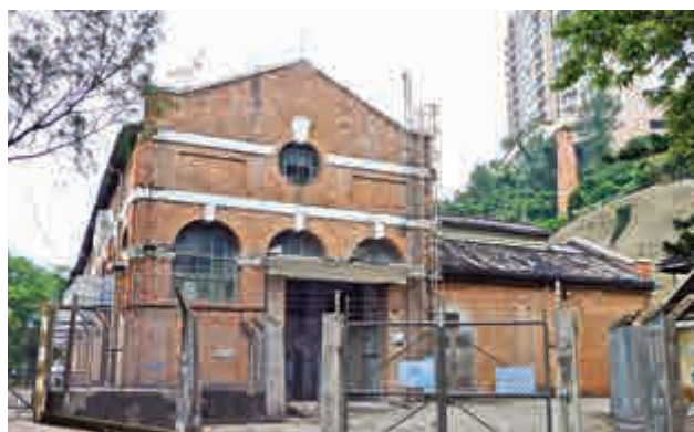
大潭篤泵房及山腰上的煙囪都是百年建築