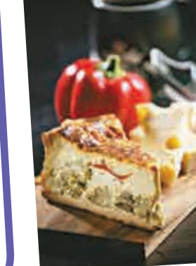
西蘭花菠菜甜椒蛋糕

新年咖啡體驗 踏入新的一年，星巴克誠邀您與親朋好友相聚星巴克咖啡店，在芳醇的咖啡香氣中，共享節日溫暖時刻。為慶祝新春佳節及情人節的到來，店內將注入濃濃的節日氣氛，並呈獻全新的味蕾驚喜，在您最愛的經典朱古力咖啡中融入創新元素，打造新年的咖啡體驗，還有多種口味的現烤糕點。同時推出的節日禮盒及商品系列，更為這個季節增添一份甜蜜與驚喜，滿載溫馨祝福。香港星巴克再度與品牌Swarovski合作推出別致隨行杯及迷你星巴克卡，為親朋好友帶來冬日時尚驚喜，多款新春猴年系列及情人節商品陸續同步上市。