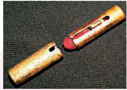
約一九一五年製作的管狀口紅 資料圖片