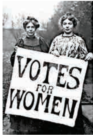
▲女性為自己爭取權益