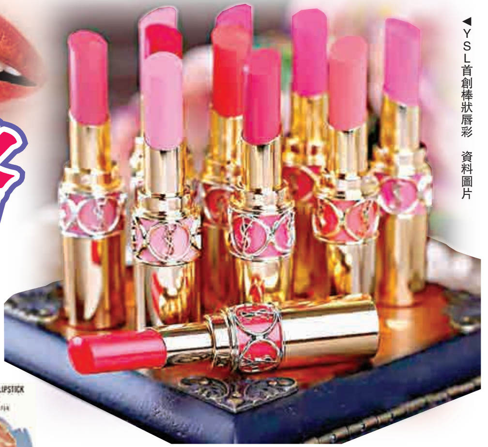
YSL首創棒狀唇彩 資料圖片