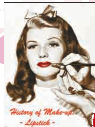
History of Makeup - Lipstick -