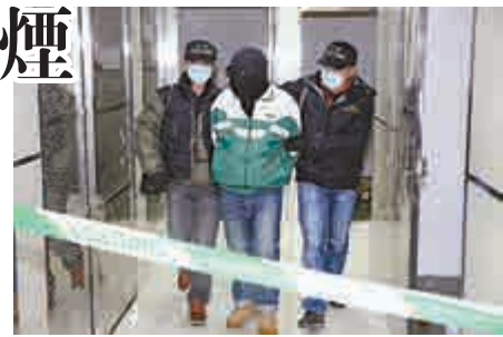
◀涉販賣私煙被捕男子

窗口抽氣扇失火，外牆亦有被熏黑的痕跡，消防員調查後認為火警無可疑，不排除是電線短路引致火警，有關方面正調查火警原因，校內的職員老師及學生，無人受傷及不適，事後全部返回工作崗位或課室內上課。