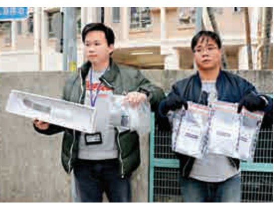
▲警方展示在白田邨搜出的利刀及毒品