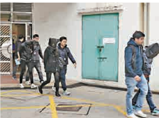
▲三名疑黑幫青年男女在白田邨被捕

【大公報訊】警方為打擊青少年毒品罪行，經情報搜集及深入調查後，昨日在青衣一酒店及深水埗白田邨一公屋單位採取突擊搜查及拘捕行動，共檢獲總值約2.5萬元的毒品以及一批毒品包裝工具，七名男女涉案被捕，當中除四人有黑社會背景外，更包括一對年僅15歲的少男少女，女生仍在中學就讀中二。警方疑有人利用青少年搵快錢心理，誘使其進行販運毒品活動，呼籲青少年提高警覺，切勿被人利用以身