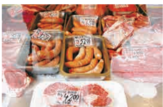
▲豬肉是丹麥飲食文化的重要部分

雖然反移民的人民黨大力推崇這項規定並認為這是傳承丹麥文化的重要舉措，但丹麥社會自由黨的前族群融合部部長薩林則指控此做法是「想灌輸意識形態，而且是強加在兒童身上」。