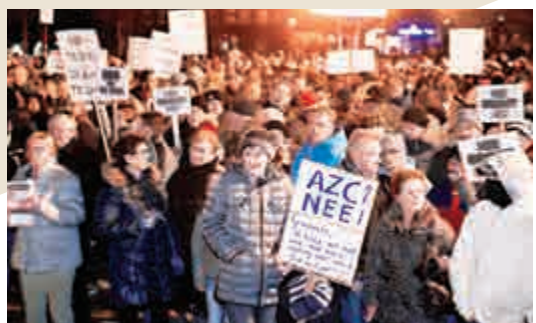
▲千名市民於本周一在荷蘭海斯示威，反對建設難民中心

官員當晚召開公開會議，商討該市在未來十年接收約500名難民。一批示威者企圖闖入政府大樓，數十人向大樓投擲雞蛋和煙火。警方驅散示威人群，並拘捕了3人。