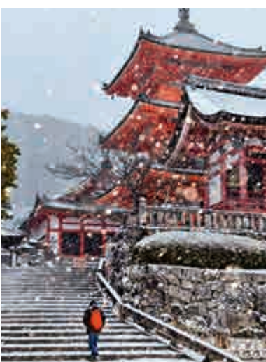
▶銀裝素裹的清水寺