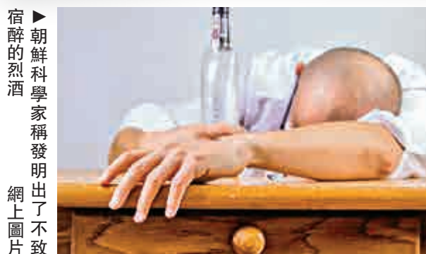
▶朝鮮科學家發明出了不致宿醉的烈酒

報導指，這波降雪及強風已經造成部分地區交通不便，位於東海道的幹線20日上午傳出超過1小時的延遲，影響許多要搭車的民眾，位於中部地方愛知縣的機場也傳出許多航班取消，愛知縣及岐阜縣總計有828起因強烈風雪而造成的事故，據傳有48人因此受傷。