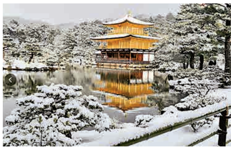
▲披着京都初雪的金閣寺