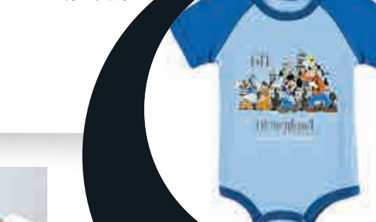
▲▶迪士尼發聲明召回的兩款童裝