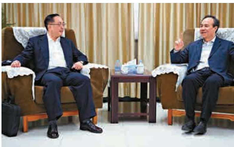
▲楊偉雄（左）昨日上午與周波（右）作禮節性會面

同行還有創新科技署署長蔡淑嫻和政府資訊科技總監楊德斌。另外，楊偉雄今日會拜訪工業和信息化部後，結束訪問北京。