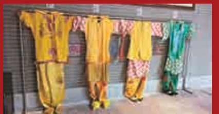
▲近代各種麒麟舞表演服