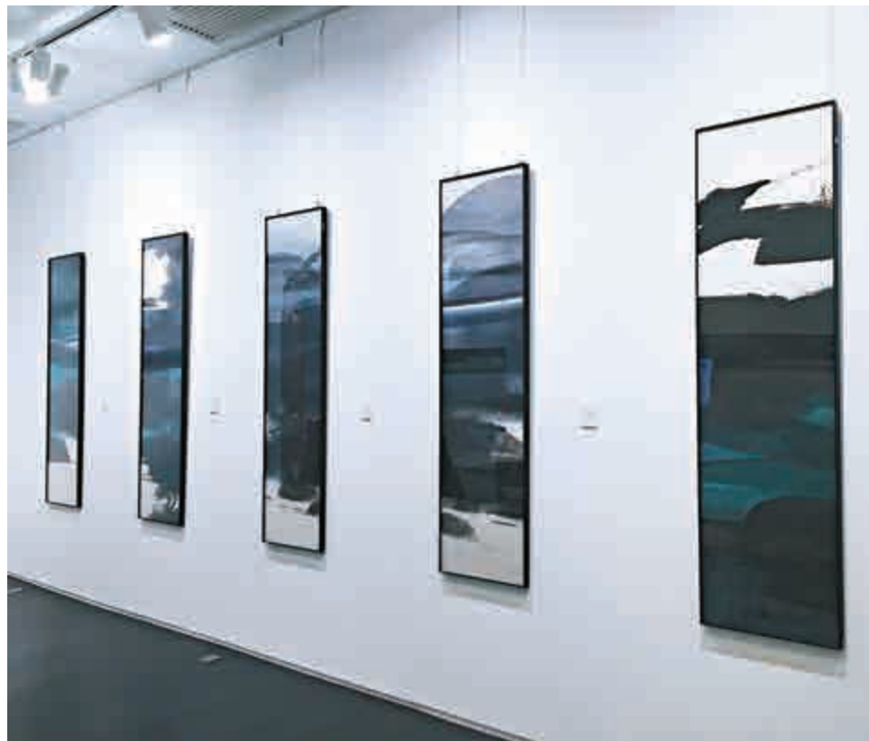
▲作品懸掛於一面牆上，互相獨立又互相融合

所謂「天地凡間」指的就是香港，在馮永基的眼中香港雖然可能不是天地間最美的地方，但在他心中因為