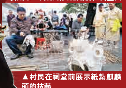
▲村民在祠堂前展示紙紮麒麟頭的技藝