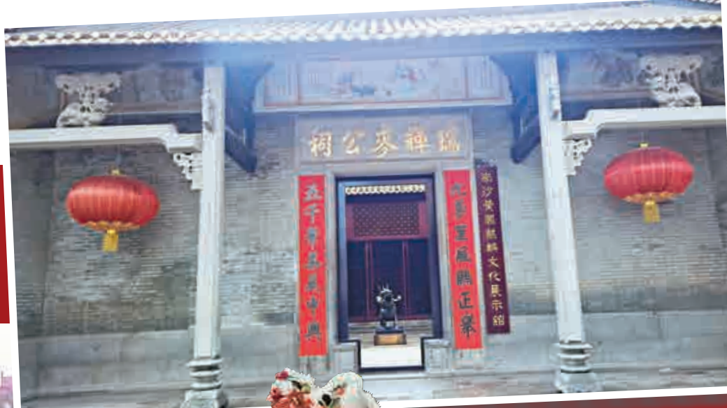
▲廣州唯一的麒麟文化館就在祠堂內

更為重要的是，黃閣打破了非物質文化遺產專案傳承的傳統束縛，向本地群眾說明麒麟舞既可傳男也可傳女，既可傳內也可傳外的道理，並組織本地群眾開展排練。當地還不斷豐富麒麟舞的內涵，組織麒麟工藝社，將麒麟融入景泰藍工藝中推出麒麟工藝畫等，系列措施和推廣活動，讓年輕一代對傳統文化有深入了解，也為麒麟舞發展提供了堅實的人才基礎。