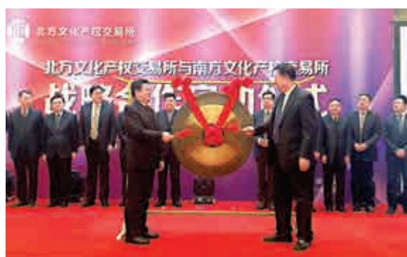
▲北方文交所創新業務上線鳴鑼