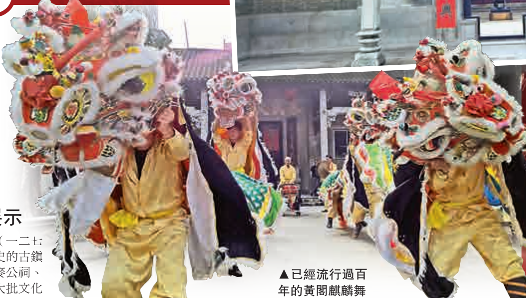
▲已經流行過百年的黃閣麒麟舞