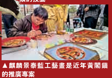
▲麒麟景泰藍工藝畫是近年黃閣鎮的推廣專案