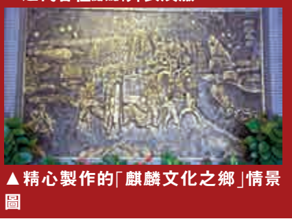
▲精心製作的「麒麟文化之鄉」情景圖