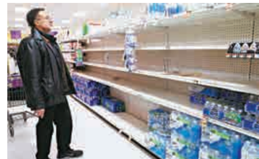
▲暴風雪將至，華盛頓多個超市貨架被囤貨的民眾搬空

如果氣象局的預測是準確的話，華盛頓本周末的降雪量，可能會超越90多年來的紀錄。在1922年，當地在短短3日內降下28吋大雪，導致一百人死亡。