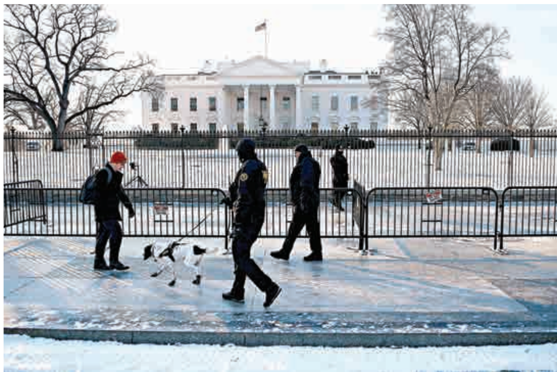
▲華盛頓21日降薄雪，白宮草地一片白色

除了陸路交通受暴風雪影響外，航空亦大受影響。美國主要航空公司相繼宣布將取消部分或全部本周末途經美東地區的航班。據估計，約