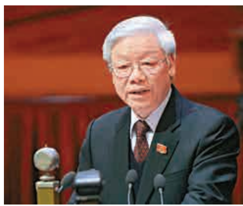
▲阮富仲21日在越共12次代表大會上發表演說

沒有人是完全不可取代的」。阮晉勇也並非「一個超級改革家」，他的繼任者無疑將繼續關鍵的經濟改革，以免引起大多數外國投資者的擔憂，Freshfields律師行的律師福斯特說。