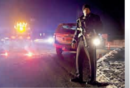
▲俄勒岡州警方26日在395號公路上設置路障