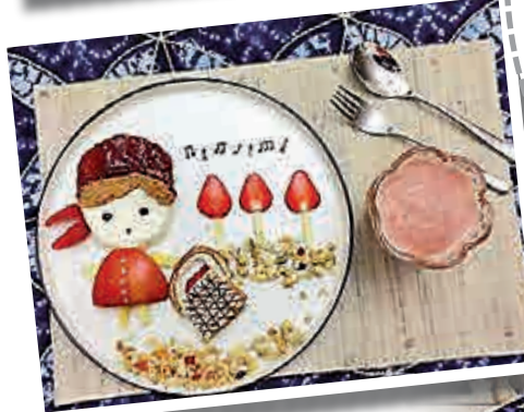
▲「童話早餐」多爲可愛的動物和公仔造型