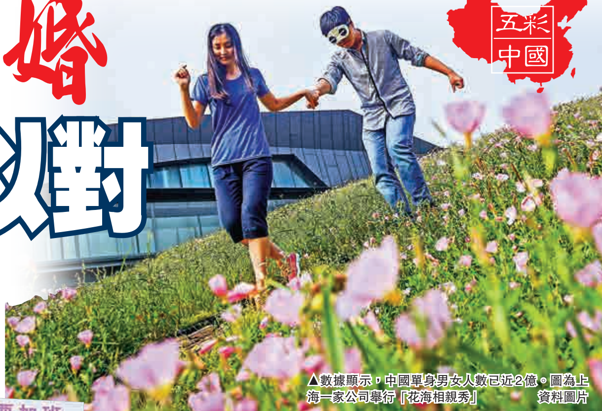
▲數據顯示，中國單身男女人數已近2億。圖為上海一家公司舉行「花海相親秀」資料圖片