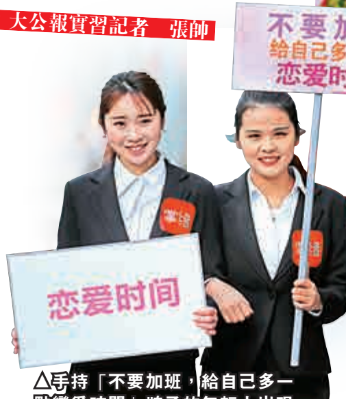
▲手持「不要加班，給自己多一點戀愛時間」牌子的年輕人出現在南京鬧市

「可憐天下父母心」。現在的適婚男女很多不在父母身邊，讓父母時時憂心。但城市生活節奏的加快，讓很多人少了談情說愛的時間和空間，要找到對的人並不簡單。如何理智地應對逼婚，將是很多年輕人必修的課程。