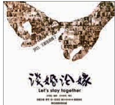
▲內地紀錄片《談婚論嫁》在網上熱播 網絡圖片