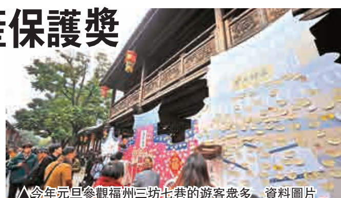
▲今年元旦參觀福州三坊七巷的遊客衆多 資料圖片

聯合國教科文組織近日向福州三坊七巷頒發2015年度亞太地區「文化遺產保護獎」之榮譽獎。三坊七巷自晉、唐形成起，便是貴族和士大夫的聚居地，清至民國走向輝煌。區域內現存古民居約270座，爲國內現存規模較大、保護較爲完整的歷史文化街區，被譽爲「明清古建築博物館」、「里坊制度活化石」。(新華社)