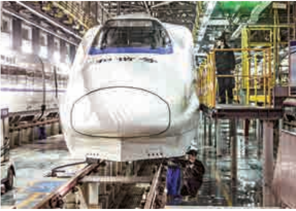
▲1月29日，在武漢動車組運用所檢修庫，機械師準備對動車進行檢修作業