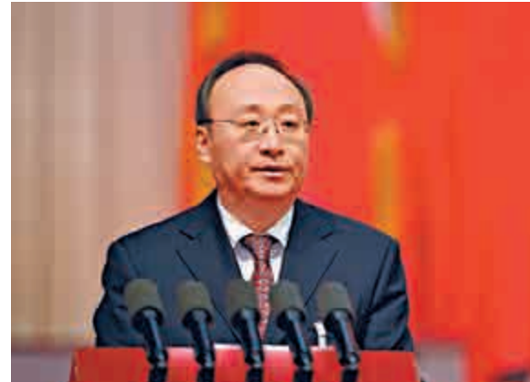
▲1月29日，四川省第十二屆人民代表大會第四次會議第三次全體會議在成都舉行，會上選舉尹力為四川省人民政府省長 中新社

此後十餘年，尹力先後擔任衛生部副部長、國家食品藥品監督管理局局長、黨組書記。2015年3月，尹力「空降」四川，由國家衛計委副主任一職調任中共四川省委副書記，次月，兼任該省省委宣傳部長。