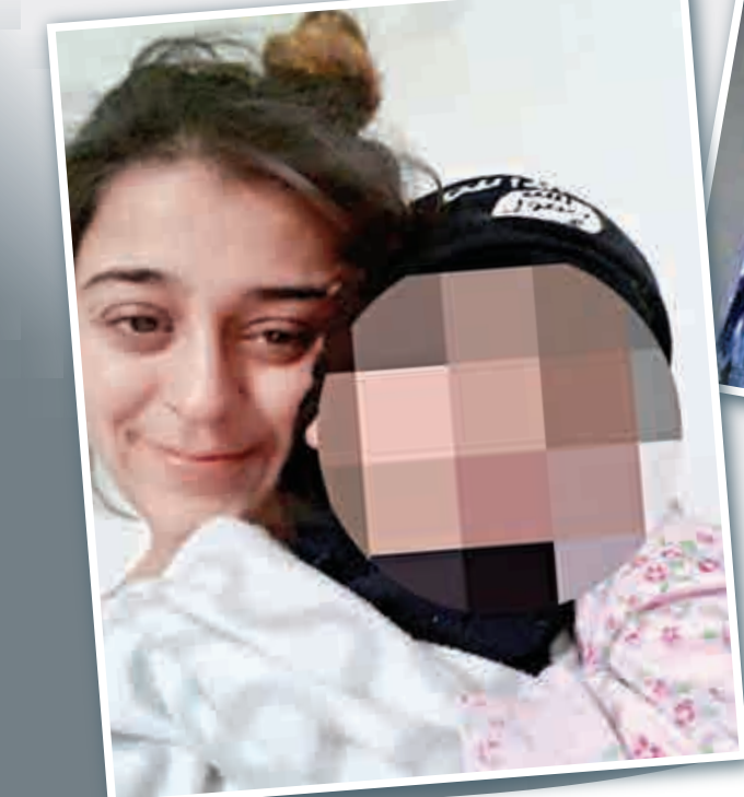
▲沙基勒與兒子的合照中，幼童的帽子上有ISIS的標誌 網上圖片