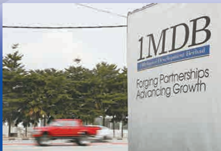
▼大馬國企IMDB在吉隆坡的廣告牌

瑞士當局預計，此項政策可能在未來造成政府每年2080億瑞士法郎(約1.5萬億港幣)的開支，其中有約3/4將來自稅收，其餘則從社保開支中撥付。而據提出該項倡議的團體稱，有調查顯示，大多數的瑞士國民即使能獲得政府的這份「月薪」，也仍會繼續工作。