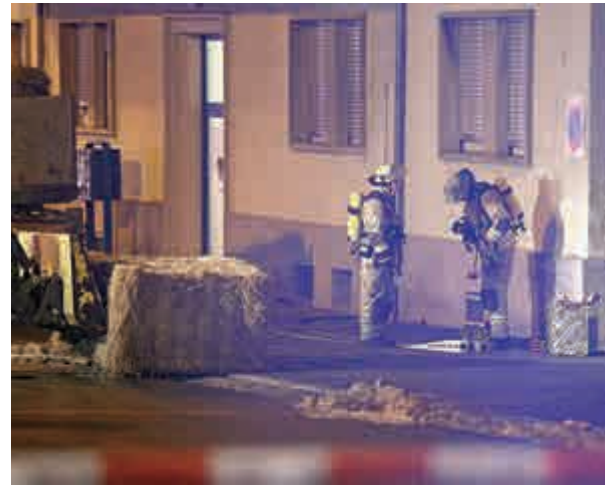
▼救援人員29日在德國被擲手榴彈的難民所工作