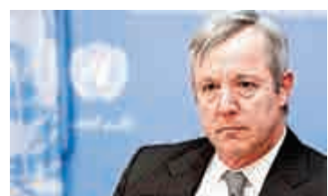
▲聯合國助理秘書長班貝利29日就性侵兒童案應答媒體

聯合國下個月將出示一份報告，公布涉及的國家名稱；並將設立專門網站，對涉及指控的維和士兵案件調查情況進行追蹤。涉案者將受到各自來源國法律的制裁。