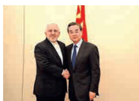
中國外交部長王毅11日在慕尼黑會見伊朗外長扎里夫

治解決敘利亞問題，各方必須真正放棄軍事手段，希望即將舉行的敘利亞國際支持小組第四次外長會就全面停火達成重要共識，為盡快恢復和談創造條件。希望伊朗為此發揮積極和建設性作用。