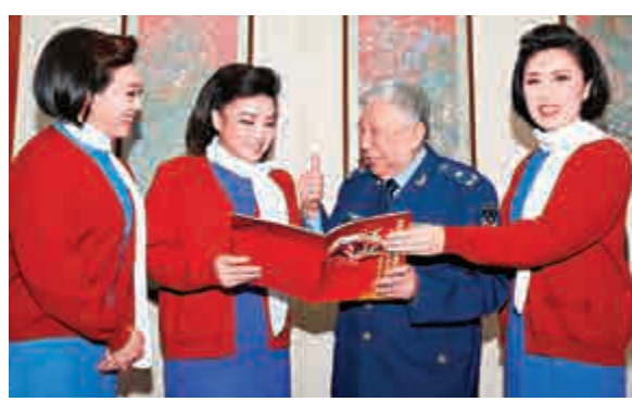
2014年11月，歌劇《江姐》赴空軍駐福州部隊巡迴演出時，劇作者閻肅（右二）和第五代「江姐」王莉一起探討舞台表演

閻肅從藝65年，在多個領域留下卓越成就，一生創作了1000多部（首）文藝精品佳作。他於上世紀60年