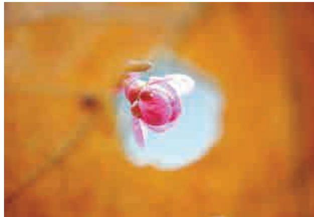
12日，西安植物園內梅花盛開，綻放春意

新華社報導，最高檢要求，檢察機關要圍繞人民群眾平安需求，積極參與打黑除惡專項鬥爭，加大對黑惡勢力犯罪打擊力度；依法嚴懲個人極端暴力犯罪，依法打擊利用寄遞物流渠道實施的犯罪，建立對偷拐騙搶、黃賭毒等犯罪常態化打擊整治機制；積極投入打擊治理電信網絡新型違法犯罪專項行動，堅決懲治電信詐騙、網絡投資詐騙、黑電台等犯罪；積極參與對犯罪重點地區的打擊整治，促進對電信、金融等領域源頭監管。