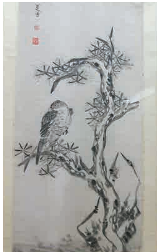
▲紀念館內展出的朱耷畫作《松鷹圖軸》