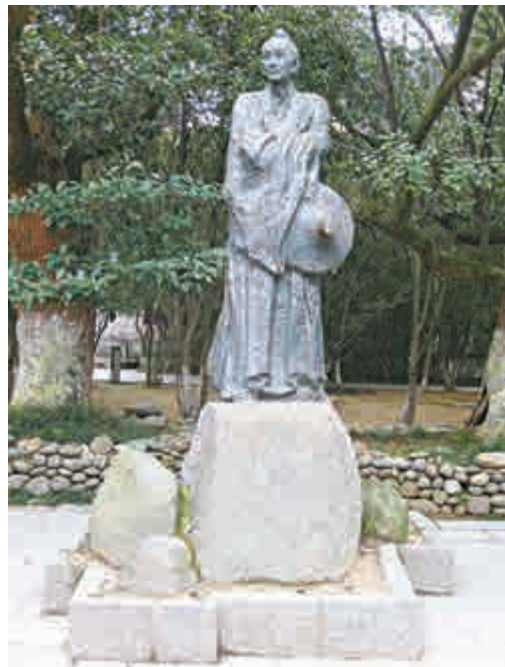
▲朱耷塑像，彷彿笑傲天下

以八大山人為核心，以傳統文化為主軸，以梅湖生態美景為紐帶的江南都市文化生態景區——梅湖景區，受曲水環繞，綠樹成蔭，面積約三千二百畝，由水墨丹青區、文化博覽區、水鄉風情區、歲寒三友區、農耕休閒區、梅村思賢區和綜合娛樂區七大功能區組成，內有景點七十餘處。八大山人梅湖景區於二〇〇七年八月十八日正式開工建設，二〇〇八年五月一日對外開放。有緣來到這裏，拍照時，小可對自己說：別的可以漏拍，八大山人塑像一定不能漏拍。在香港這個繁華地方住久了，覺得人心充滿了執拗，龐雜多面情緒，忽地滿眼遇到景物宜人的景區，而悠閒之間偏偏又蘊藏了非比尋常的文化，亦古亦今、亦動亦靜、亦柔亦剛，小可心情也為之波瀾起伏，對八大山人的愛慕和好奇心又增加了幾分！