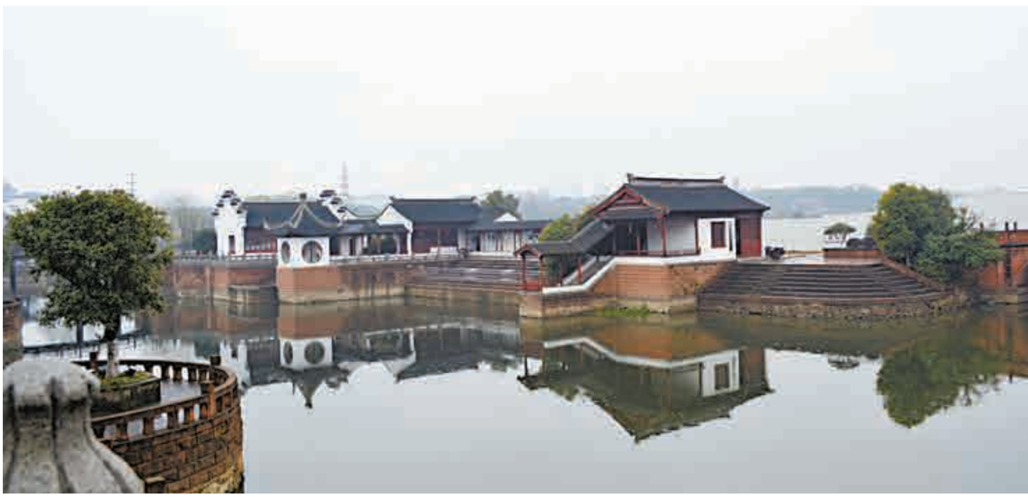
◀曲水環繞的八大山人梅湖景區

近日，兒輩及其友人都有為事業、財富，及愛情等問題不知如何應對，而引致情緒低落不可終日。他們都是三四十歲，都有大學以上的教育水平，而且多是專業人士，為社會的支柱。但他們所受的教育或知識架構，都找不到可應對的辦法，所以大多數斯密在他的巨著《原富論》就指出問題，當今的資本主義下要生存，就要「專門」，越專門，則你的競爭力就愈大。所以我們有專業人員。而專業人員要不斷專門，就是要在本業愈鑽愈深，知識面就愈專，其他知識則一概不用，離開本專業或本知識則是在空白的。 香港大部分人都豐衣足食，而精神上總是不安，正如明朝陳繼儒所形容：「煩惱之場，何種不有？無事而憂，對景不樂，即自家亦不知何緣故，這還是一座活地獄。」 這種精神狀態惶惶不可終日，如何安其心呢！我們則可以向中國文化去尋找，我國的先賢是如何解決呢？ 其實所謂精神壓力自古皆有，我試舉一例。近日讀到清朝乾隆年間的紀曉嵐，此君可謂名滿天下，一般人以為他風趣幽默，又是《四庫全書》總纂修官，學問了得，是乾隆皇帝身邊重臣，歷任兵部侍郎、禮部尚書、協辦大學士等。晚年身居高位的紀曉嵐，直處於清廷錯綜複雜的矛盾漩渦之中，動輒得咎的境遇使他既惶恐不安，同時為了自己及家人的安危又不得不處處謹慎小慎，因此在心理上處於焦慮不安如履薄冰的狀態。當時乾隆已八十多歲，剛復自用，不可理喻，有幾次乾隆差點小事降罪於他。紀曉嵐八十歲後辭官退休在家中，還是天天驚恐乾隆忽然下旨殺他。雖然他不怕死，但考慮到小孫兒在上學時忽然被捉去斬首，你想是何等壓力。我對對兒輩說，你如遇有壓力，你尚可向移民或辭職不幹，但紀曉嵐則不可，你說他壓力有多大。從紀曉嵐晚年的詩文可看到一兩篇寫他內心的恐懼，但不多見，因怕跌進乾隆的文字獄，連發世一下都不可。 因為我國幾千年都是專制，個人受到政治社會禮教的壓力，所以紓解此等壓力都充塞着文化的每個領域，例如文學、歷史、哲學及藝術（書畫欣賞亦可降壓），詩詞方面更多得很多。 例如蘇東坡思念亡妻之痛，如你不幸有相同的悲痛大可讀讀他的名詞《江城子》：「十年生死兩茫茫，不思量，自難忘。千里孤墳，無處話淒涼。縱使相逢應不識，應憐面，鬢如霜。夜來幽夢忽還鄉，小軒窗，正梳妝，相顧無言，惟有淚千行。料得年年腸斷處，明月夜，短松岡。」