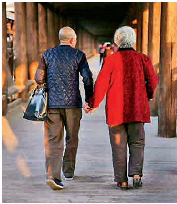
▲執子之手，與子偕老