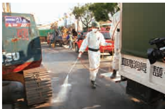
▲台南市維冠大樓倒塌現場14日持續進行清理工作，軍隊出動化學兵協助消毒作業

台灣教育部統計此次地震全台共計468所學校受災，39名學生死亡、29人受傷；傷者有22人已出院，7人仍住院，學校災損金額達新台幣2.69億元。