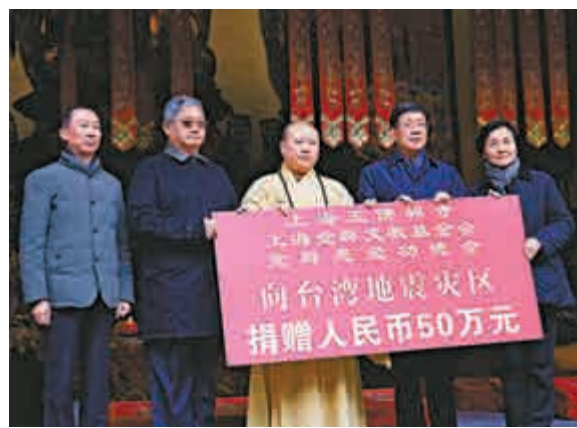
▲上海玉佛禪寺14日在大雄寶殿隆重舉行為台灣地震災區捐贈儀式及祈福超薦法會 中新社

此外，14日上海玉佛禪寺為台灣地震災區舉行捐贈儀式及祈福超薦法會。據介紹，中國佛教協會副會長、上海玉佛禪寺方丈、上海覺群文教基金會理事長覺醒大和尚獲悉這一消息後，第一時間通過上海玉佛禪寺官方微信及個人微信號「般若文室」為受災同胞祈福。14日舉行的捐贈儀式上，上海玉佛禪寺、上海覺群文教基金會、覺群慈愛功德會向台灣地震災區捐贈50萬元。