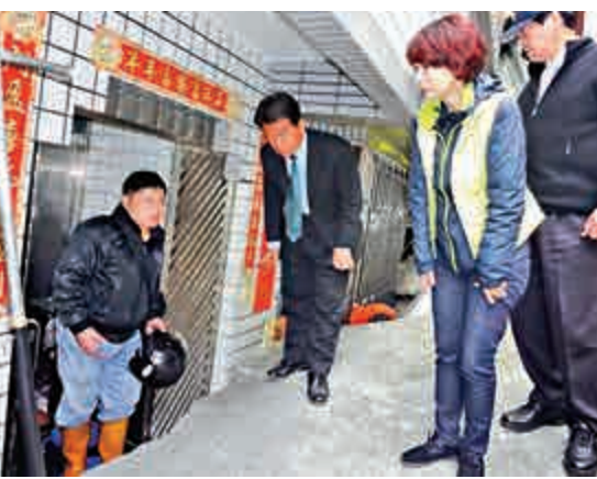
▲台南市一棟民宅下陷約1.5公尺深