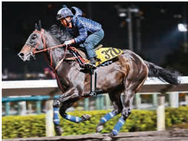
「精算追擊」渾身是勁

「安荃」近仗表現雖未算理想，但跑回田草二千，曾是贏馬路，仍以莫雅策騎，爭勝分子。「快樂神駒」首次跑田草八米後段轉弱，今次配以莫雷拉，特加操磨，當可爭取較好成績，此駒在外地贏過長途賽，增程力足亂大局。「同個世界」今季跑三仗未有功，上次谷草走勢回起，今次跑田草二千會上名，還有作為。冷腳取「文藝復興」。