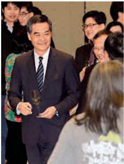
▲立法會舉行新春酒會，行政長官梁振英（左）應邀出席。

【大公報訊】記者龔學鳴報道：立法會昨日舉行新春酒會，社民連議員梁國雄再度做騷搞事被逐，立法會主席曾鈺成諷其行徑是做「馬騷戲」。 曾鈺成又期望官員及議員在今屆剩下的五個月會期中互相包容，多做對市民及社會有利的事。