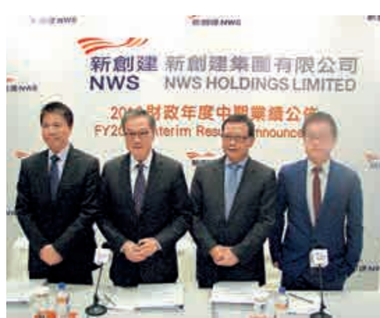
►新創建稱，今年年底南港島線通車，公司期望可透過重組及削減班次，減少影響