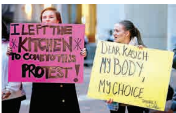
▲女性示威者抗議卡西奇歧視女性的言論

倫齊對羅西獲獎表示祝賀，他說，這部紀錄片的主題值得我們所有人關注。他打算在下月初舉行的歐盟與土耳其關於難民危機的特別首腦會議期間，送給其他27個歐盟國家領導人每人一張DVD。「我希望他們能抽出時間看一看，然後可能會以不同的思路討論問題」。