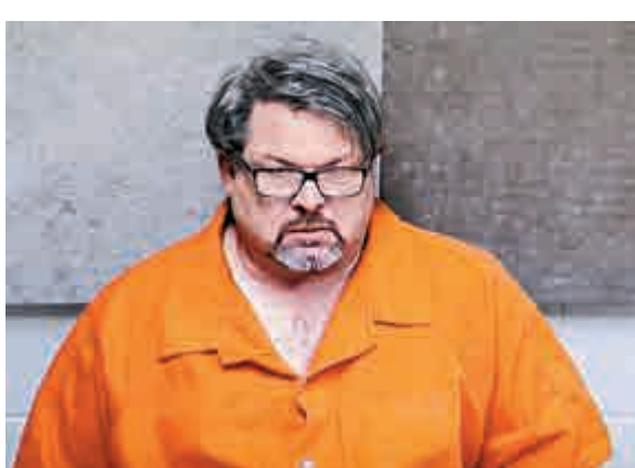
▲密歇根槍擊案兇手達爾頓是一名Uber司機

蘇利文談到Uber背景調查時說：「在了解一個人有沒有犯罪紀錄這方面，我們認為自己表現相當不錯。」Uber背景調查方式，包括若在網絡上找不到資料，公司會派人到法院以手動方式找相關文件，同時也會從乘客評價和每趟全球衛星定位系統(GPS)紀錄，評估司機狀況。