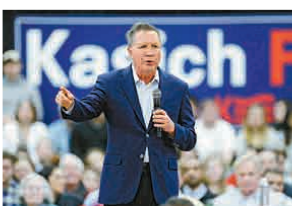
▲美國俄亥俄州長卡西奇

民主黨總統參選人希拉里隨即即在Twitter發文，說卡西奇和現代女性脫節。「現在已是2016年，女性的地位已不同以往，體化精神已能隨心所欲。」