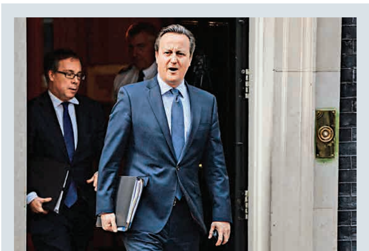
▲英國首相卡梅倫22日離開唐寧街10號前往議會

對於卡梅倫的言論，坐在他身後的約翰遜憤怒不已，連連搖頭，大聲喊道：「廢話，廢話。」他在離開議會前面對記者詢問保守黨是否已出現內戰，明確表示「沒有」，還說保守黨十分團結。有政治專家指出，如果歐盟公投結果是留在歐盟，保守黨的裂痕恐難消弭；如果公投決定英國退出歐盟，卡梅倫即使堅持與他無關，但首相位子也難保。前外交大臣韋林在《每日電訊報》撰文說，在歐盟問題上出現的分歧會帶來創傷，將需要「一代人的時間去彌合」。如果保守黨在歐盟公投議題上分裂加劇，可能影響2020年的大選。