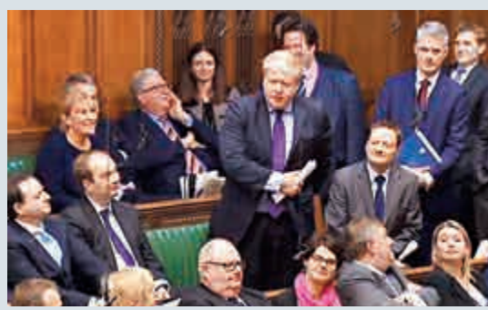
▲倫敦市長約翰遜22日在議會發言 視頻截圖