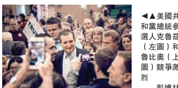
▲美國共和黨總統參選人克魯茲(左圖)和魯比奧(右圖)競爭激烈