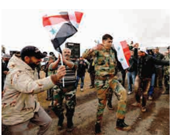
▲敘利亞志願軍22日結束軍事訓練

【大公報訊】綜合美聯社、新華社報道：美國與俄羅斯22日發表聯合聲明，宣布敘利亞內戰的停火協議，交戰各方將在大馬士革時間27日零時起，停止敵對狀態。