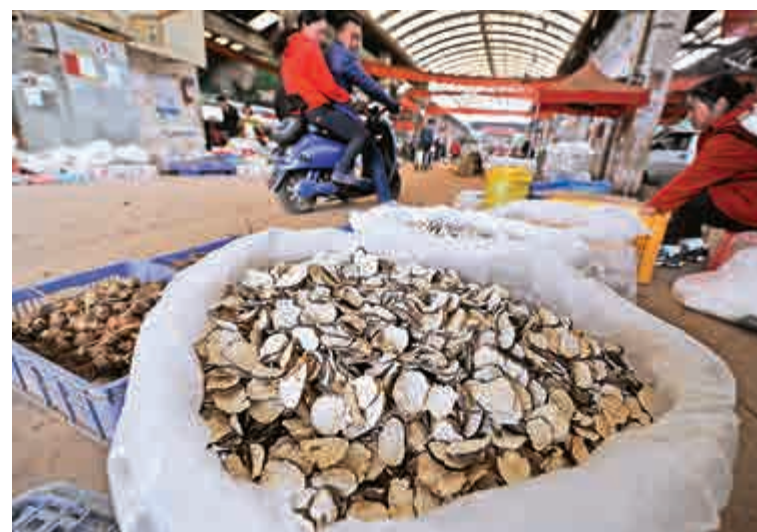
◀二十三日，昆明市場上售賣瑪卡的商人與顧客