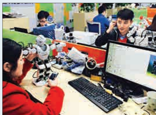
▲Alpha 2更加智能化，能實現人機交互

在周劍看來，機器人的想像空間十分巨大，未來智慧家居的入口將是一個可以交互的產品，它讓未來家庭生活變得更加便捷和有趣。