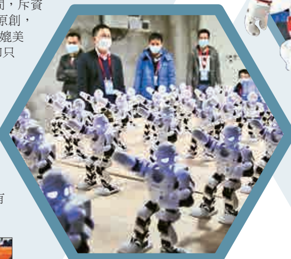
◀為春晚表演的Alpha 1S進行排練