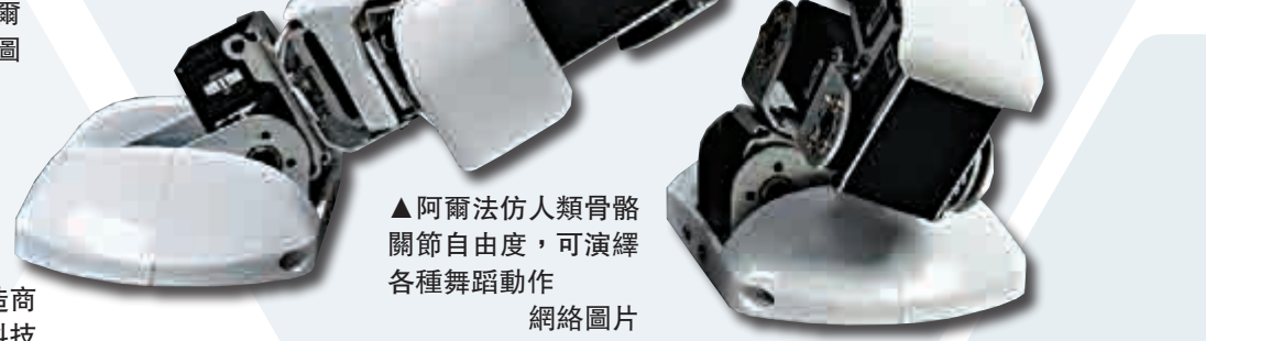
▲阿爾法仿人類骨骼關節自由度，可演繹各種舞蹈動作

談及今年的央視春晚，最受矚目的莫過於內地歌星孫楠同台表演的540台跳舞機器人阿爾法，有網友更直呼其場面酷似「現代版的兵馬俑」。此次登台的是阿爾法家族的一代產品Alpha 1S，研發製造商是深圳優必選科技有限公司。事實上，機器人表演並非新鮮事，去年深圳高交會上就有阿爾法機器人跳《江南Style》、《小蘋果》等節目，但540台機器人同時進行表演尚屬首次。有人甚至為這群機器人軍團申請了健力士世界紀錄。