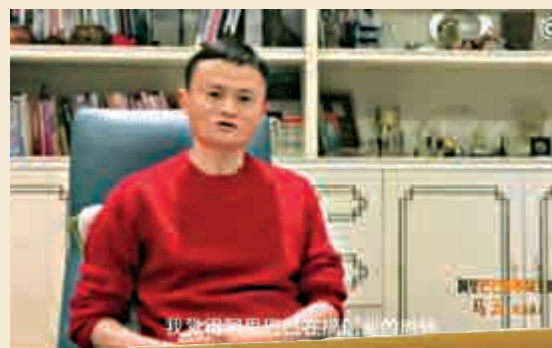
◀阿里巴巴董事局主席馬雲特別錄製視頻向金庸祝壽 視頻截圖