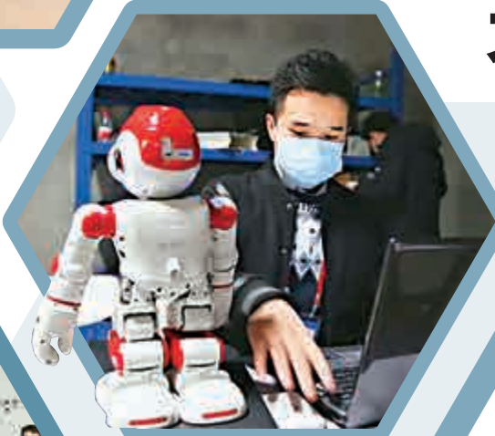
▲工作人員對阿爾法Alpha 2進行調試