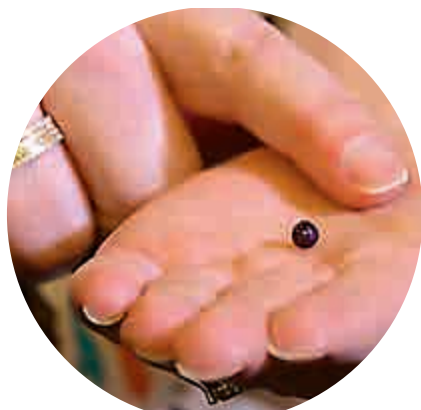
▲哈茲展示其意外吃到的罕見紫珍珠

【大公報訊】據美聯社報道：美國華盛頓州一名婦女在一家意大利餐廳享用海鮮大餐時，意外咬到一顆價值約600美元（約港幣4662元）的罕見紫珍珠。