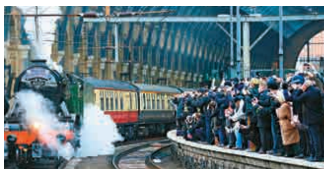
▲「飛天蘇格蘭人」號25日在火車迷的掌聲中出發

「飛天蘇格蘭人」號1月重返英格蘭西北部的伯里，進行一連串檢測後，25日是它首度正式行駛。