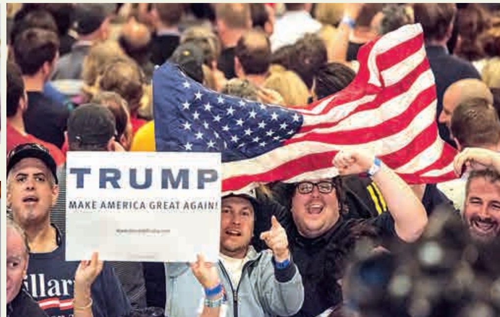
▲內華達州特朗普的支持者23日慶祝其在該州初選中獲勝