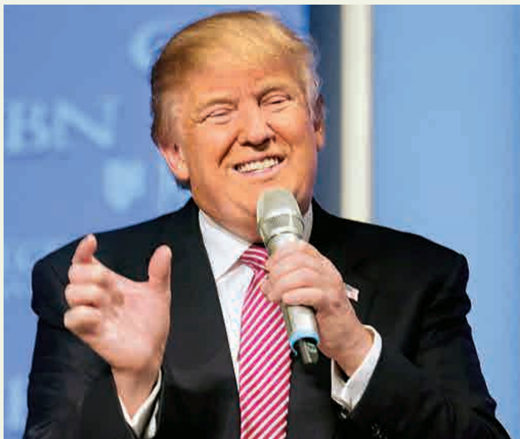
▲特朗普24日在弗吉尼亞州造勢

據悉，這個網站並不是第一個在美國大選過程中「脫穎而出」的加拿大網站。此前，一名身居加拿大的美國作家和一名加拿大演員開玩笑指美國的「悠閒」鄰居或許應該掌管美國政治。他們在網上宣布「加拿大」參選美國大選，表示如果「加拿大」當選美國總統，美國或會更美好。他們上傳的視頻獲得了3700萬點擊。