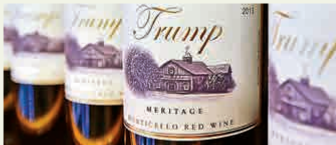
▲▼拉斯維加斯特朗普酒店內以其名字命名的紅酒（上圖）和朱古力（下圖）