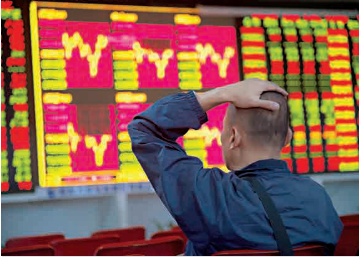
▲滬指昨日再現V型反轉漲0.95%。當日滬深兩市50余股漲停，近1300股上漲

另據最新數據顯示，QFII（合格境外機構投資者）已連續49個月新開帳戶。其中，QFII在上月新開立7個帳戶。至此，QFII開立帳戶總數達到了984個。截至2月24日，QFII有279家，合計批准807.95億美元（折合人民幣約5278.98億元）的投資額度。