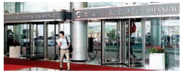
▲上交所本周共對96起證券異常交易行爲進行調查，共出具書面警示函92份

據了解，本周上交所公司監管部門共發送日常監管類函件14份，其中包括三份監管問詢函，七份監管工作函，三份重大資產重組預案審核意見函，及一份定期報告事後審核意見函。同期，上交所共對96起證券異常交易行爲進行調查，涉及證券78隻次、證券帳戶163個次、證券公司52家次，共出具書面警示函92份，針對投資者實施盤中暫停帳戶交易17次，並上報中證監一起涉嫌違法違規案件線索。