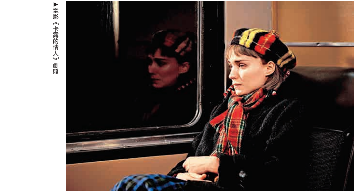
▲電影《卡露的情人》劇照