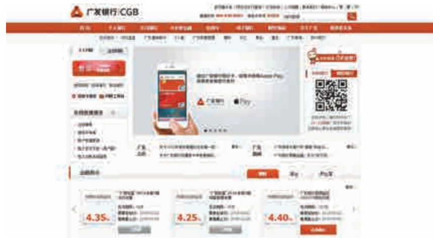
▲國壽表示，廣發銀行在零售、小微等領域具有較強的差異化競爭力

廣發銀行成立於1988年，是內地首批組建的股份制商業銀行之一，註冊資本為154.02億元，註冊地點為廣東省廣州市。截至2015年12月31日，中國及澳門設立759家營業機構。2015年全年，廣發銀行除稅後溢利為90.64億元，較2014年同期下跌24.7%。