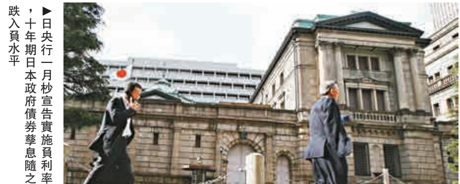
日本央行1月1日宣佈實施負利率，10年期日本政府債券息率隨之跌入負水平