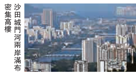
沙田城門河兩岸滿布密集高樓

社區發展亦激發鐵路服務的演進，九鐵於一九七八年開始電氣化工程，一九八三年全線通車。同年大圍臨時站投入服務，火車站於一九八五年啓用，以減輕沙田站的壓力。沙田由滄海變桑田，再由墟市變商場，農田消失，取而代之的是高樓冒起。如今重看舊照，真的可用「翻天覆地」來形容這半世紀的變遷。