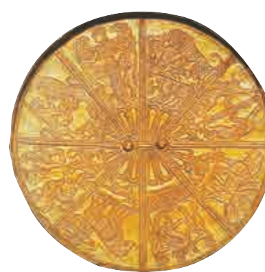
公元前金箔浮雕圓鏡

子（背面），於高加索地區出土，現藏於列寧格勒博物館。金箔鏡背分八等份，分別浮雕造型不同的人、神、獸，精美無比。那時正值華夏的春秋時代，其工藝技術不遑多讓。