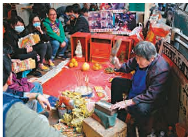
▲檔主梁婆婆手起鞋落，將紙小人打得啪啪響