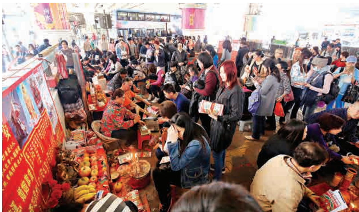
▲驚蟄全日近千人逼爆灣仔鵝頸橋底

除了人頭湧湧的打小人攤檔外，鵝頸橋底亦有一、兩檔攤位售賣12元一份的「打小人套裝」，包括香燭、小人紙、紙老虎、肥豬肉等。檔主稱，她不會替客人打小人，認為這會「折福」，只會替客人用「打小人套裝」祈福。