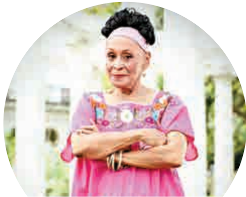
▲現年八十六歲的女主唱Omara Portuondo