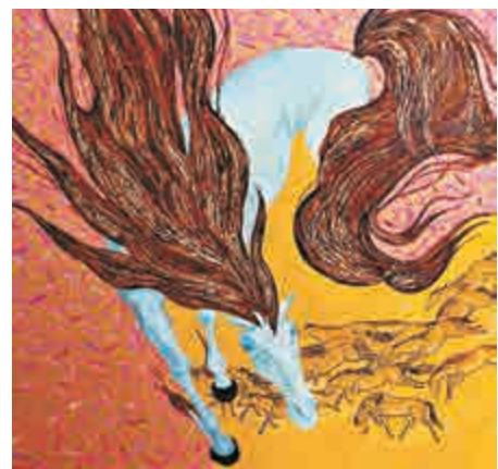
▲巴圖巴特關於馬的作品