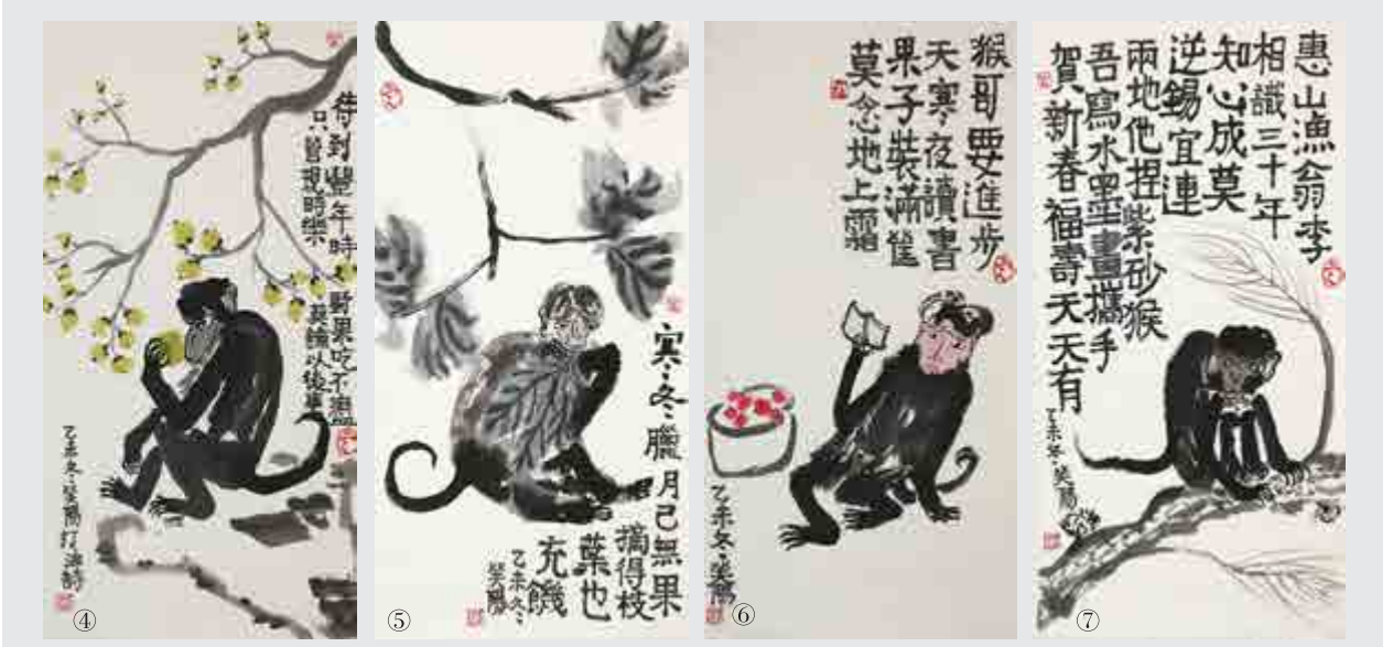
④待到豐年時 野果吃不盡 祇管現時樂 莫論以後事 ⑤寒冬臘月已無果 摘得枝葉也充饑 ⑥猴哥要進步 天寒夜讀書 果子裝滿筐 莫念地上霜 ⑦惠山漁翁李 相識三十年 知心成莫逆 錫宜連兩地 他捏紫砂猴 吾寫水墨畫 攜手賀新春 福壽天天有

以配詩猴畫為起點，笑陽將完成一個系列的十二生肖賀歲詩畫配，作出持續一個周期的探索與開拓，這無疑是一個別開生面的創意。他必將在傳承傳統文化，追尋藝術表達與當代存在關聯的道路上邁出更大的步伐。（文：黃玉明）