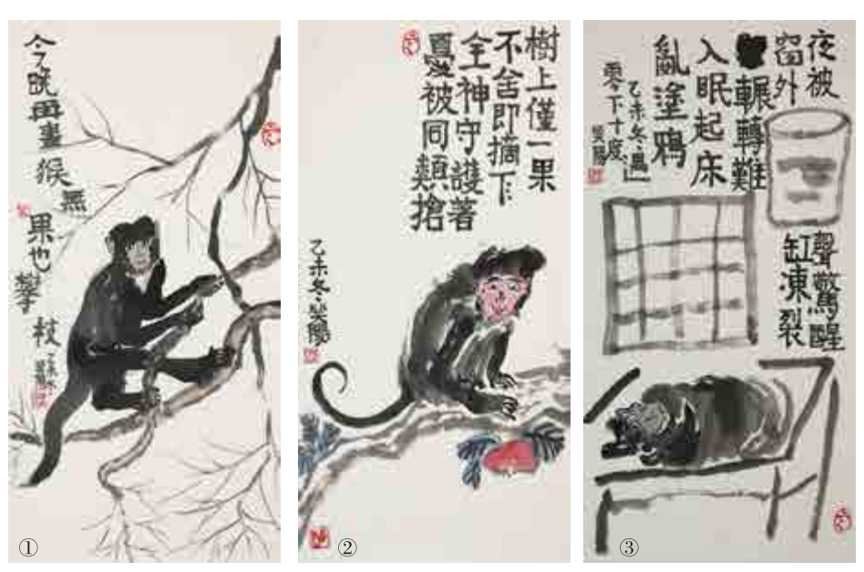
①今晚再畫猴 無果也攀枝 ②樹上僅一果 不捨即摘下 全神守護著 憂被同類搶 ③夜被聲驚醒 窗外紅凍裂 輾轉難入眠 起床亂塗鴉

近幾年來，笑陽人文關懷題材的詩歌、陶藝、國畫作品，長流水，不斷綫，出現了不少極具感染力的作品。真實，對藝術家來說，就是要在作品中抒發真情實感，從某種意義上說，這比筆墨上的企求更重要。笑陽熱愛生活，善於觀察生活，他將畫中猴擬人化，以隨筆式的詩句或「順口溜」，表達人文關懷，體現關心人、愛護人、尊重人，著眼於生命關照，著眼於人性，注重人的存在、人的價值、人的意義，尤其是人的心靈、精神和情感。畫中猴成為他關注人的生存與發展的素材，他的猴畫成功地表達出他自己的一些創想和感慨。比如，他心中不時會冒出這樣一個詰問：當下，人們憑借勞動和智慧過着不錯的生活，可是，缺乏幸福感，這是為什麼呢？他以一幅幅猴畫及其「順口溜」作出了回答。其中一幅寫道：「捏着手裏的，惦記身邊的，瞞眼樹上的，想得天上的。」這就是真實，真實的描繪，真實才有力量！早有人發聲說，商業社會的發展動力是不斷挑起人們的物質欲望。我們的收入增長十倍時，我們的欲望已經增長了百倍，被欲望綁架成為無數中國人不快樂的根源。「順口溜」通俗易懂，朗朗上口，讀者喜聞樂見。如「天上落仙果，河裏遊小魚，要問誰逍遙，猴哥說了算」、「不管樹上結多少，該是我的跑不掉，吃飽才是好日子，健康快樂最重要」、「待到豐年時，野果吃不盡。祇管現時樂，莫論以後事」。