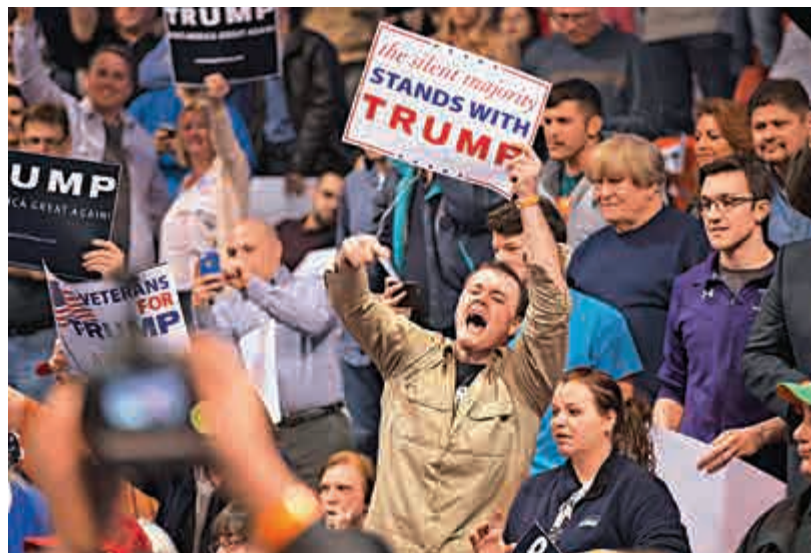
▲特朗普的支持者11日在集會現場高喊口號