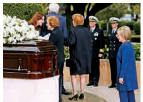
▲希拉里（右一）11日在里根夫人南希的葬禮上致哀

迫於強大的壓力，希拉里很快在推特上公開道歉。她說：「里根家族會大力提倡幹細胞研究及找出阿茲海默症的療法，我說錯他們在HIV病毒及愛滋病方面的成績了。我對此道歉。」