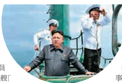
▲2014年6月，朝鮮領導人金正恩乘坐潛艇視察

美軍一直在朝鮮東部海域監視這艘潛艇，直到它突然停止移動。美國間諜衛星、飛機和船隻幾天來一直在秘密觀察朝軍的搜索行動。美國官員表示，這艘70英尺長、柴油動力的「鮭魚級」小型潛艇有2名船員，但目前不清楚潛艇上是否還有其他人員。