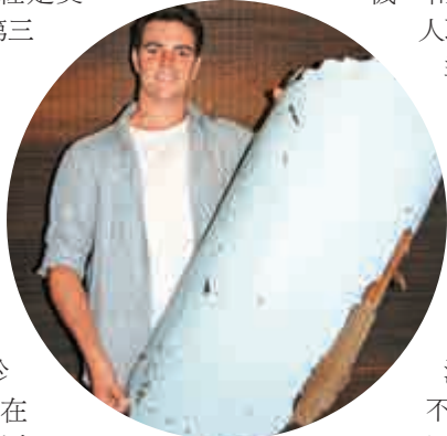
▲南非少年連恩展示他檢獲的疑似MH370殘骸

馬來西亞交通部副部長阿都阿茲透露，MH370多數乘客家屬已經決定接受賠償，不接受賠償的家屬將通過訴訟由法庭決定賠償數額。