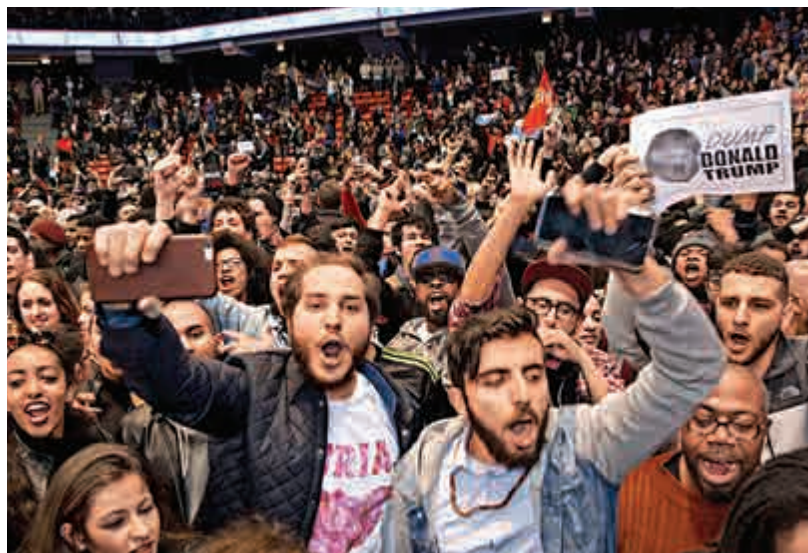
▲反對特朗普的人士11日在集會場地示威