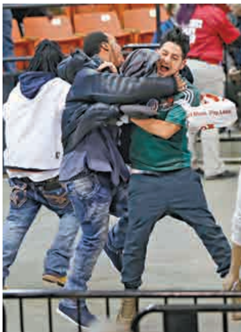
▲雙方在集會現場互毆