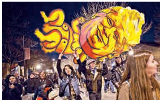
▲芝加哥示威者高舉特朗普公仔表示不滿