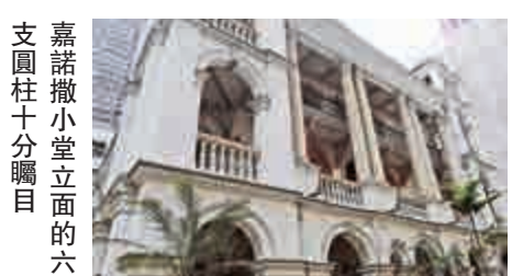
嘉諾撒小堂立面的六支圓柱十分醒目

具百年歷史的建築物，展現有別於今天的設計潮流。香港的古老教堂主要分兩類風格：古典復興式（在意大利盛行）和歌德復興式（常見於英國和德國），前者像嘉諾撒仁愛女修會小堂，後者有聖約翰座堂和聖母無原罪主教座堂，它們留存至今，為現代城市添上獨特姿采。