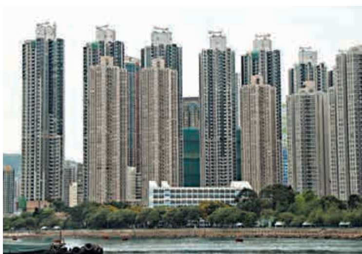
▲李嘉誠認為，本港建築成本高昂，加上地產商實力雄厚，樓價難大幅下調

唐代「章懷太子」李賢作此詩句，以感悟高宗與武則天不能再廢太子，否則像黃台之瓜摘了一遍又一遍，第四次就沒有瓜可摘了。