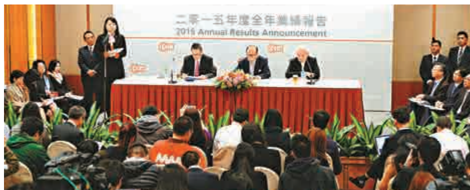
▲長和去年核心淨利潤321億，按年增長36%，優於市場預期