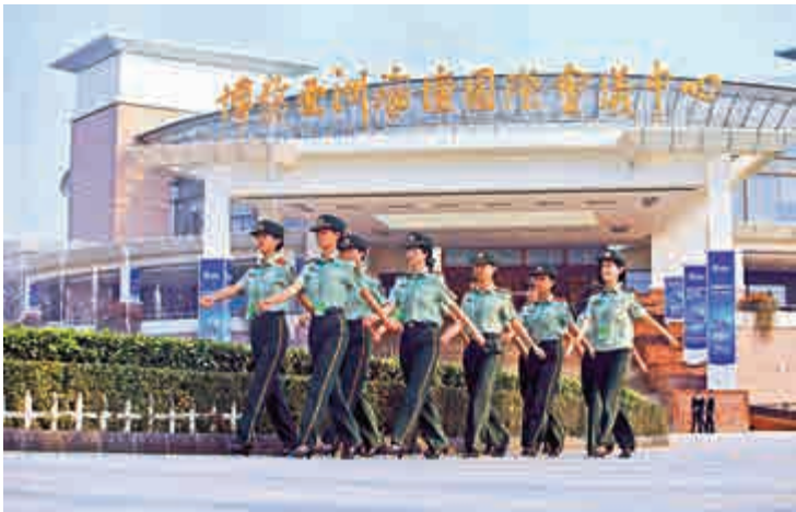
▲武警海南總隊備戰2016年博鰲亞洲論壇年會安保