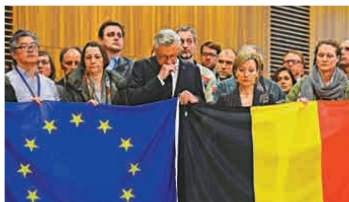
◀歐盟官員23日為比利時恐襲遇難者默哀

去年巴黎發生連環恐襲後，布魯塞爾當局已斥資四億歐元（約34.8億港元），提升保安和情報工作。不過有保安專家認為，政府架構臃腫、情報部門資源不足、邊境開放和武器黑市活躍，都令比利時成為恐怖分子的溫床。巴黎恐襲嫌犯薩拉赫4個月來成功在布魯塞爾躲藏和活動，同時也證明了比國在提升安保方面任務艱巨。