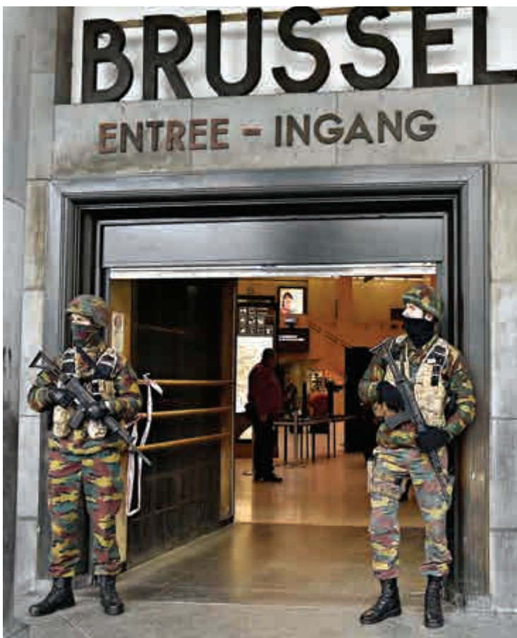
▶全副武裝的警察23日駐守在布魯塞爾中央車站入口處