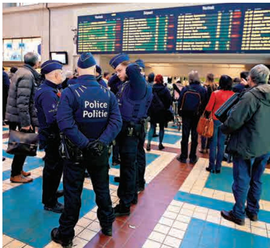
▲比利時軍警23日在布魯塞爾北站內巡邏