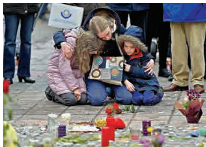
◀一名女子帶着孩子在布魯塞爾市中心的易廣場悼念恐襲遇難者