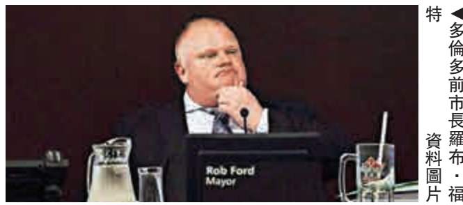
◀多倫多前市長羅布·福特 資料圖片

2015年5月，福特腹部腫瘤切除，隨後病情惡化，最後轉入臨終關懷護理病房。2015年10月，加拿大大選期間，福特曾在保守黨領袖斯蒂芬·哈珀的競選活動中現身。