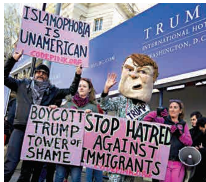
▲反對特朗普的民眾21日在華盛頓特朗普酒店外示威