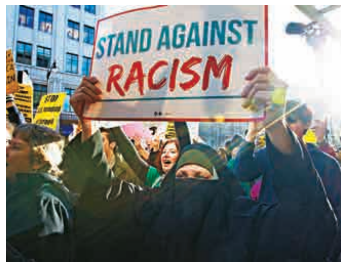
▲示威者高舉「反對種族歧視」的標語