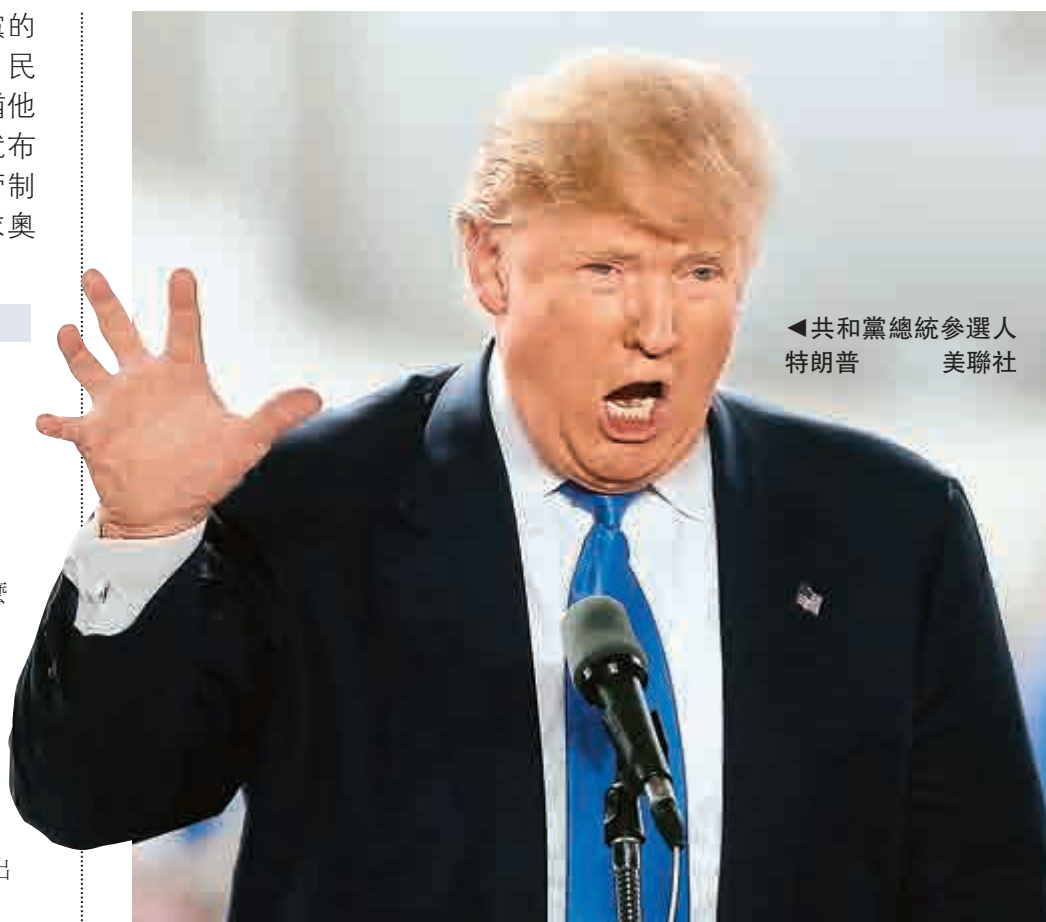
◀共和黨總統參選人 特朗普