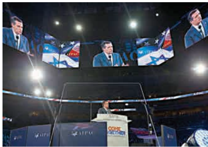
▲克魯茲21日在華盛頓演講

希拉里藉機抨擊特朗普和克魯茲的觀點。「我們必須強化和擴展我們的戰略，美國需要加強與歐洲和北約的合作，而不是弱化。」她還駁斥了特朗普要實施水刑和酷刑的主張。「那是他另一個站不住的主張。我們最優秀和最勇敢的軍事情報領導人會告訴你們，酷刑無效。」希拉里說，特朗普所建議的收緊邊境、阻止穆斯林進入美國，「顯示缺乏對於我們系統如何運作的了解」。