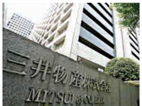
▲三井物產株式會社在周三表示，今年會撤帳23億美元

退出歐盟的前景已經導致英鎊下跌。外匯策略員表示，英鎊存在風險溢價，很少投資者相信英鎊已跌至可以買入的水平。如果英鎊跌至1.3502美元水平，將是1985年來最低，交易員相信公投當天英鎊跌至此水平的機會有59%。有外匯交易員預期，今年年中，英鎊將跌至1.38美元水平。周四英鎊兌美元曾報1.4076水平。經濟員預期如果英國公投結果是退出歐盟，英國的經濟將會陷入衰退，年底時英鎊將會跌至約1.15美元。