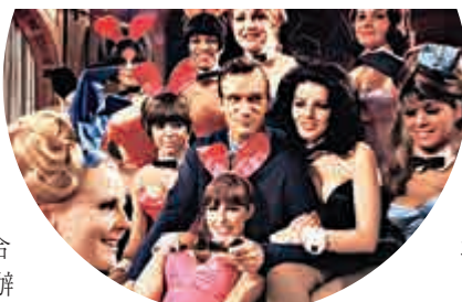
▲花花公子創辦人 Hugh Hefner(中)與 兔女郎們

公司發言人表示，已僱用美馳集團剖析出售或其他策略性選擇，公司或將選擇分割成數個部分出售，或根本不出售。據悉，Playboy於2011年私有化的交易價格為2.07億美元。在網路可輕易存取色情內容的年代