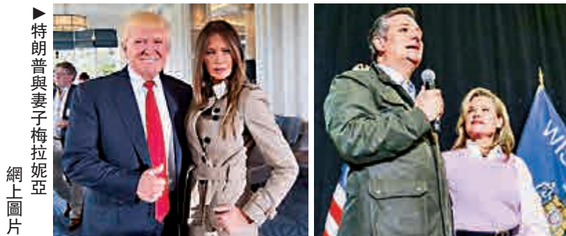
►特朗普與妻子梅拉妮亞

媒體分析，Tay的事件不但暴露出互聯網以及人性的黑暗面，也突顯出人類要如何設計、訓練人工智能，以免它最後反過來不利人類這個嚴肅議題。