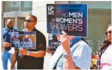
▲保守派抗議讓民眾按自己的性別意識選廁所

羅來納的跨性別民眾。」另有證據顯示，否決性別平權，恐會影響城市形象和經濟。譬如，喬治亞州也才在上個月通過決議，企業、政府或個人只要祭出宗教和言論自由大旗，都可以表達對多元性別族群的歧視意見。此舉引發許多企業抗議，華特迪士尼影業集團表示，如果法案真的執行，未來不會在喬治亞進行任何影片的拍攝或製作。