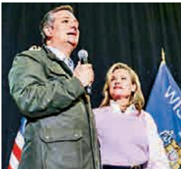
◀克魯茲與妻子海迪