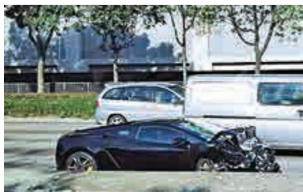
▲黑色林寶堅尼跑車車頭損毀嚴重

【大公報訊】兩部俗稱「狂牛」的林寶堅尼跑車，昨晨在屯門公路行駛期間，發生首尾「追撞」意外，意外中無人受傷，兩車分別車尾及車頭損毀。警方調查期間，現場交通一度受阻，有路過網民拍下兩車意外照片，其中追撞前車的黑色林寶堅尼跑車外表損毀較嚴重，網民戲稱：「牛頭不及牛硬呢！」 據資料，兩車首次登記車價分別為約440萬港元及330萬港元，總值近800萬元。其中一車的車主為公司登記，另一車由黃姓男子登記為車主，涉事兩款跑車受不少香港及內地富豪喜愛。