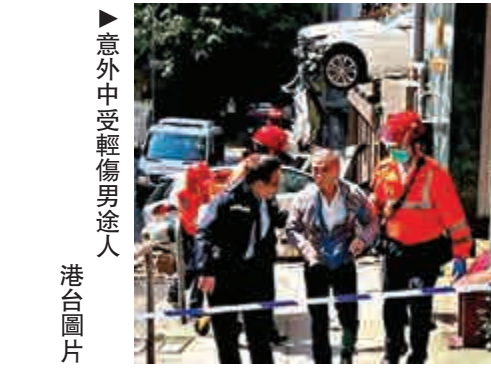
►意外中受輕傷男途人 港台圖片