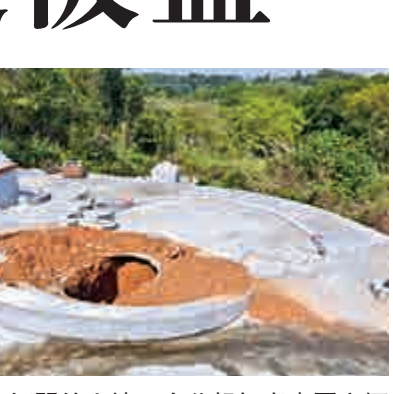
▲被人掘開的山墳

兩年前，附近曾發生墳墓被破壞事件，當時他的先人墳墓未被破壞，不料今次遭殃。他估計有村民的祖先墳墓裏，可能有少量陪葬金器，吸引村外人垂涎。馮先生的胞弟亦稱，他們的先人約在2000年下葬，預計今年八月起骨，未料卻遭匪徒打擾。 警員接報到場，在石湖圍山邊殯葬區內巡視，發現有另外三個山墳亦被掘開及破壞，亦有棺木遺棄在墳旁，遂將現場一帶封鎖，並通知有關當局找尋該山墳後人往現場點算，但初步點算後未有報失財物，探員則在現場拍照及調查。案件暫列刑事毀壞案，由邊境警區刑事調查隊第四隊跟進，暫時無人被捕。 米埔村的黃姓村長表示，疑發生「打劫死人」案件現場，為石湖圍內的新譚路山邊，上址共有過百個山墳，按數字劃分