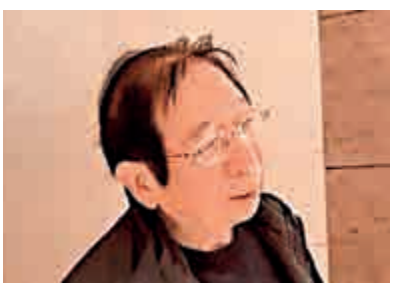
▲肇事醫生稱致電鄰居商討善後和道歉 電視截圖 ▼被撞私家車車主一臉無奈 電視截圖