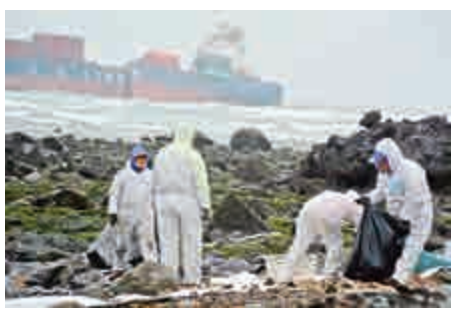
▲「德翔台北號」貨輪日前擱淺，漏油污染北海岸，船公司26日加派人手清理油污

【大公報訊】據聯合報報道：3月10日前在新北市石門海域擱淺的貨櫃船「德翔台北號」，還來不及清除船上的重油、腐蝕性化學品等污染物，船體25日凌晨斷成兩截，重油洩漏污染逾1.5公里岸際礁石和沙灘，若無法控制危機，北海岸面臨生態浩劫，也重創漁業及休閒產業。