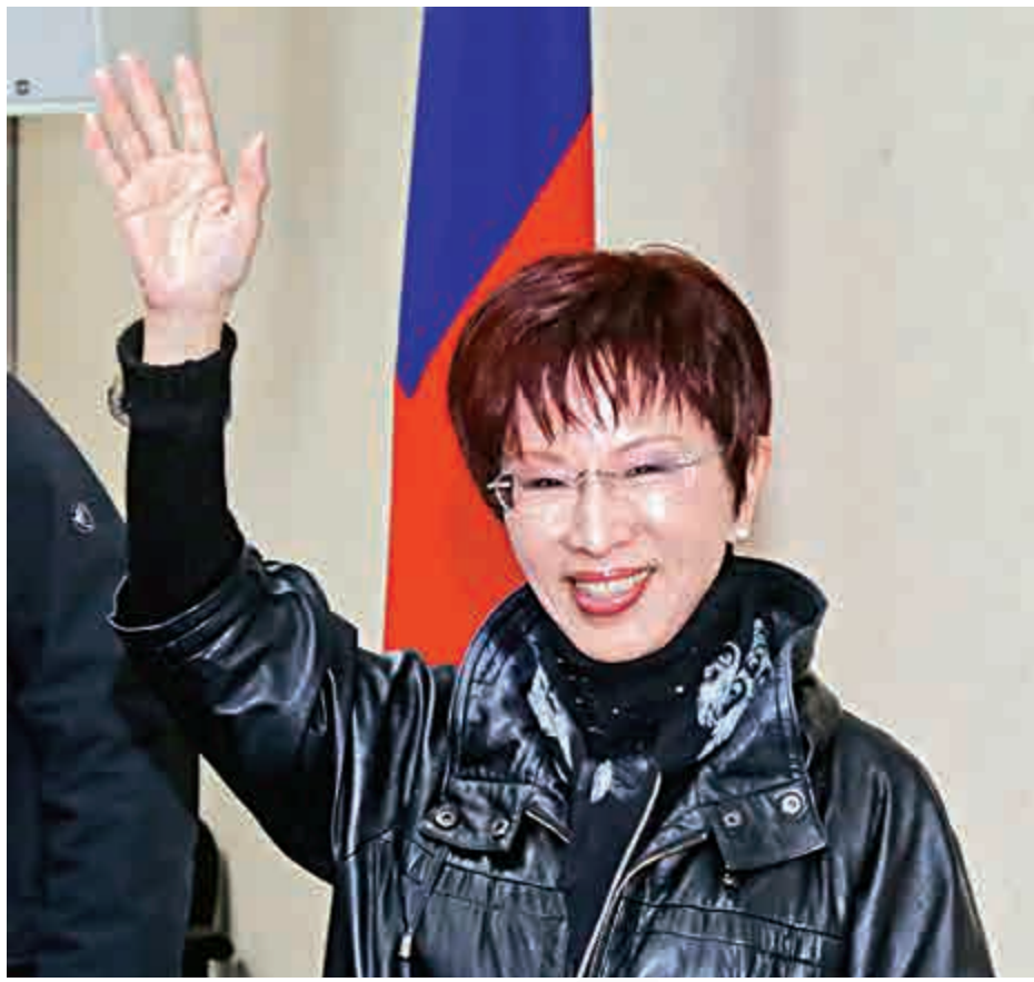
▲國民黨主席26日補選，前「立法院」副院長洪秀柱當選，晚間在中央黨部發表當選感言前向媒體揮手致意