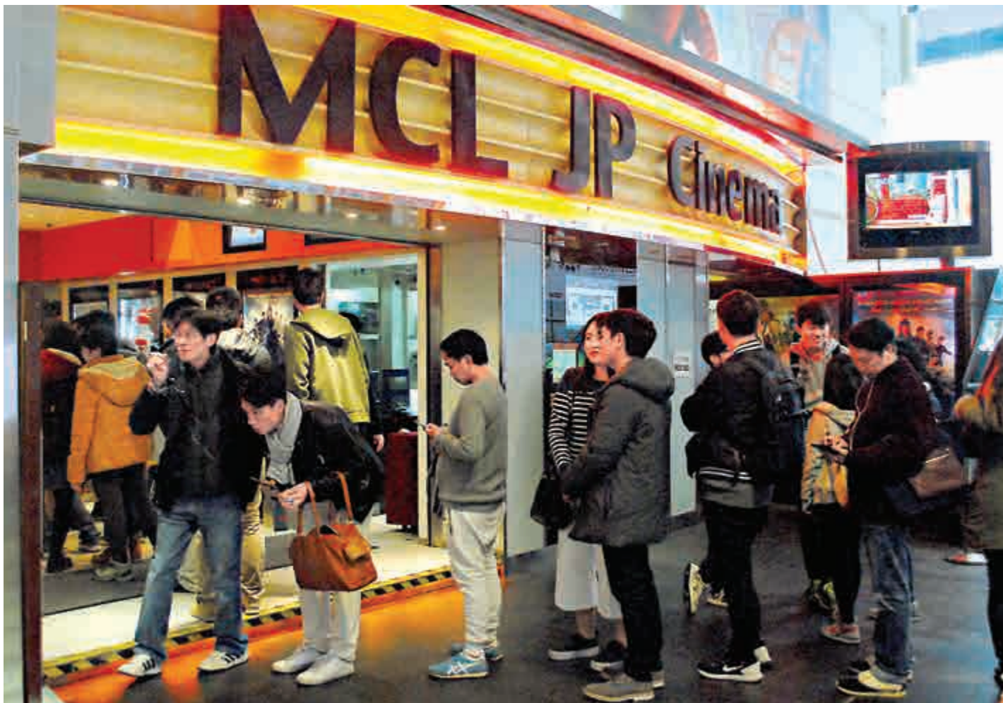
▲全港戲院去年錄得2700萬觀眾入場，創10年新高紀錄

立法會體育、演藝、文化及出版界議員馬逢國認為，現時院線覓地建院不可行，因為成本太高，但在商場經營的戲院亦同樣面對加租難關，「當商場唔需要戲院人流，就會加租。」他促請政府盡快落實《施政報告》中扶助戲院發展的措施。