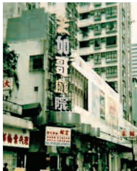
▲原址位於元朗水車館街的芝加哥戲院已結業