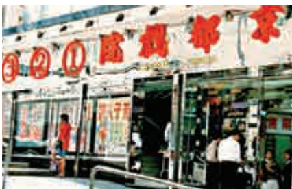
▲灣仔京都戲院於1969年2月15日開幕，已改建為教會