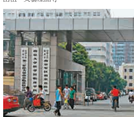
▲南京軍區南京總醫院 網絡圖片

據了解，1998年，軍隊停止進行企業化生產經營，部分企業無償移交地方，部分企業保留，更名為有償服務。最典型的有償服務是軍隊醫院（90%為地方人員看病）、軍隊院校、軍隊科研機構、軍隊倉庫、門面房出租、文藝產品等。