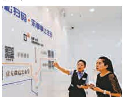
▲蘭州銀行工作人員向顧客介紹掃描二維碼辦理銀行業務的方法

《報告》統計，截至2015年底，在主流綜合性理財平台中，創業公司背景的機構佔比29%，其次是P2P公司和互聯網公司。