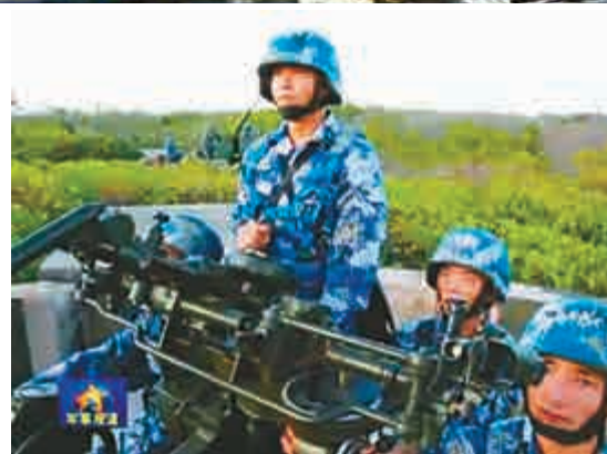
▶琛航島守備部隊進行對空射擊訓練 央視截圖