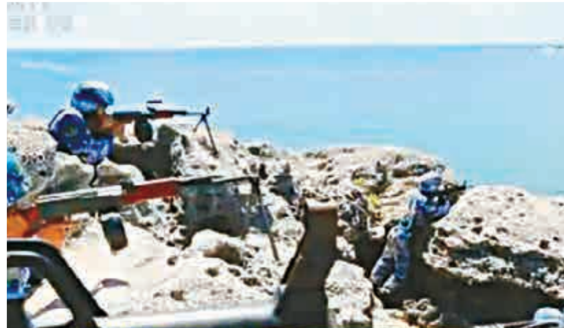
▲琛航島守備部隊進行輕武器射擊訓練 央視截圖