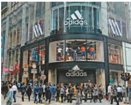
▲中環Adidas旗艦店明天開幕

店內首設具專業運動知識的品牌顧問坐陣，為顧客提供諮詢服務及建議；另外亦設有「shoe bar」互動桌面，配合兩大輕觸式屏幕，讓顧客輕易尋找合適產品及相關資訊。