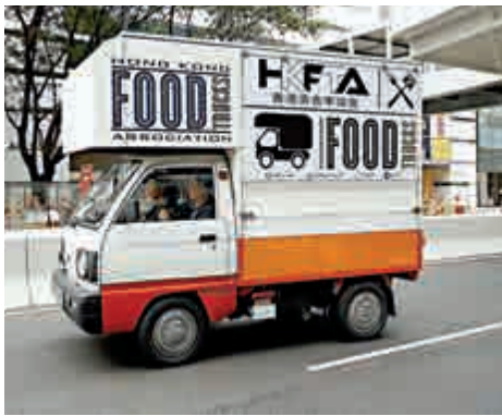
▲十六架美食車最快年底在八個固定點營運 資料圖片