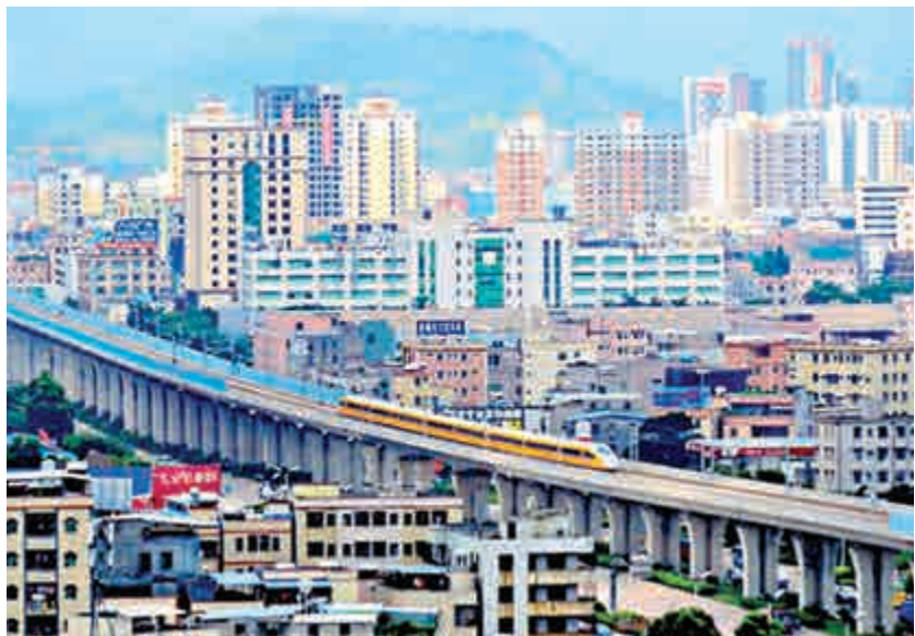
▲莞惠城軌途經東莞常平鎮 網絡圖片