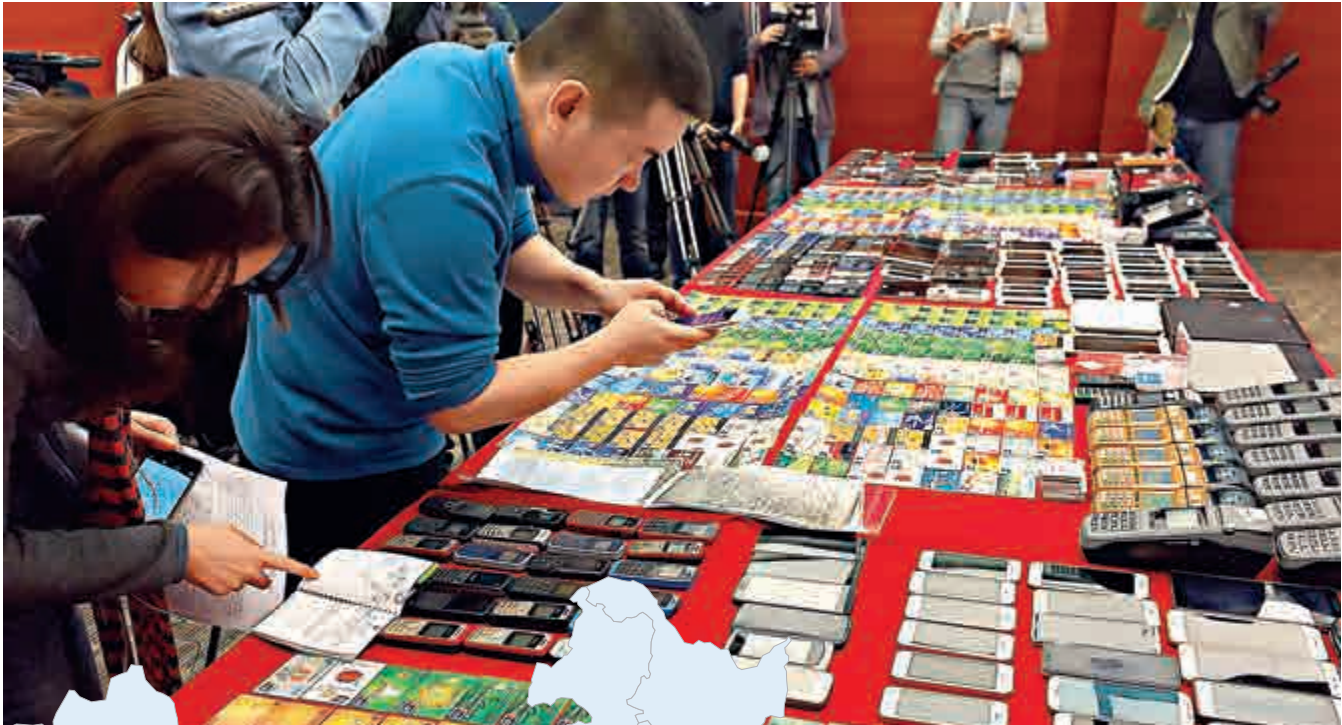
▲粵警展示電信詐騙團夥一批贓物及作案工具

這些詐騙團夥並僱請外地人在全國作案，且日趨年輕化，特別是以「90後」為主，他們犯罪區域廣、危害大，受害者遍及內地和港澳地區，既有高層領導也有普通市民。