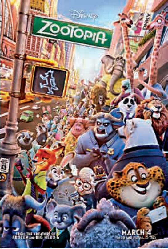
▲《瘋狂動物城》電影海報

然而這樣一部被譽爲「迪士尼沒動畫中真誠作品之一」動畫作品，實至名歸，值得咱們華人影視圈膜拜。