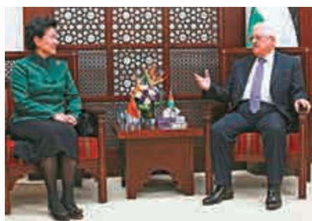
▲3月31日，劉延東（左）在拉姆安拉會見阿巴斯

【大公報訊】據新華社報道：中國國務院副總理劉延東當地時間3月31日對巴勒斯坦進行正式訪問，分別會見巴勒斯坦總統阿巴斯、總理哈姆達拉。