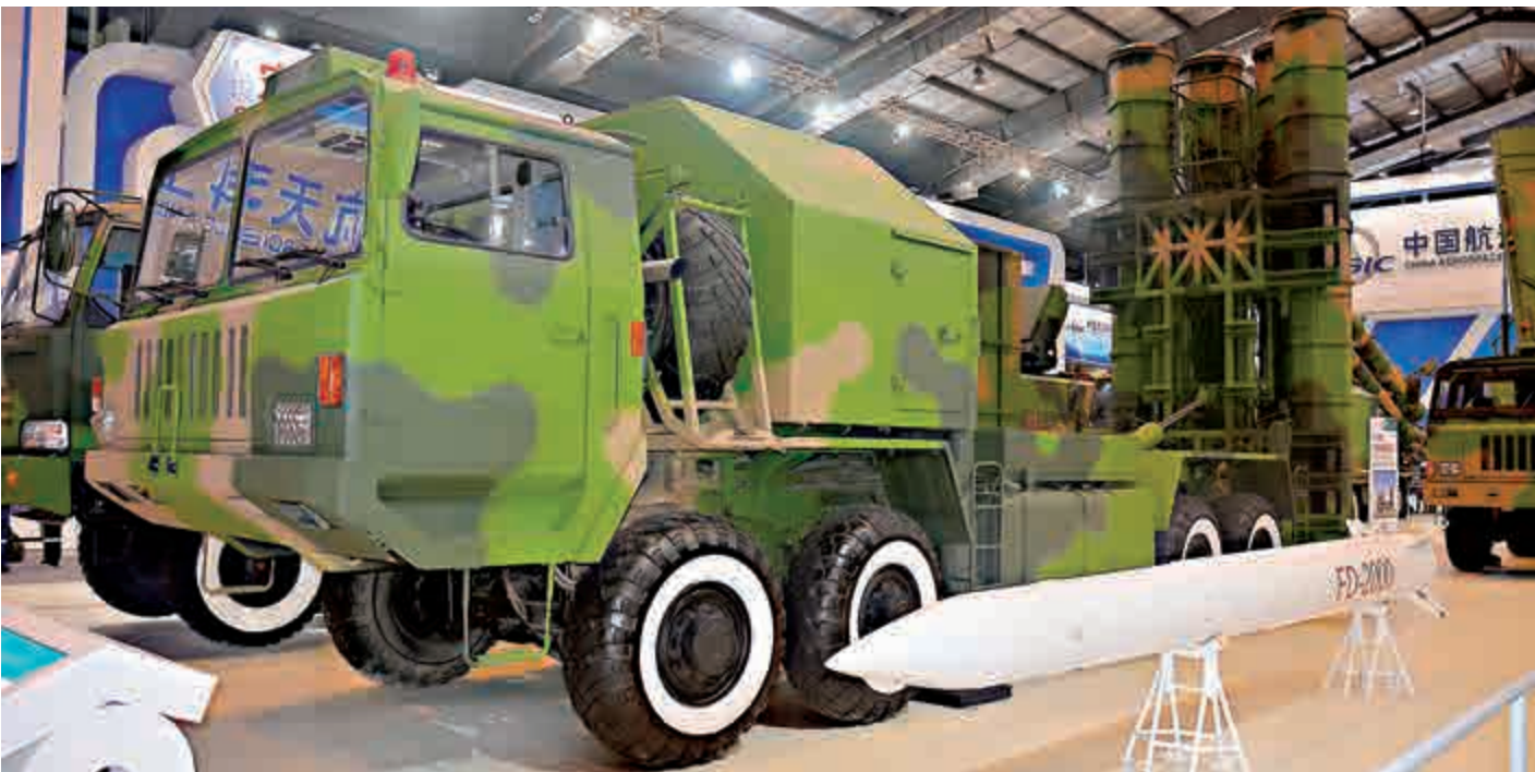
▲FD-2000防空導彈(紅旗9防空導彈出口型)

有軍事專家分析，中國向土烏兩國出口的紅旗9地空導彈，應該在2015年交付，經過近一年的訓練，於今年3月份土庫曼斯坦大規模戰備檢查軍演時正式亮相。