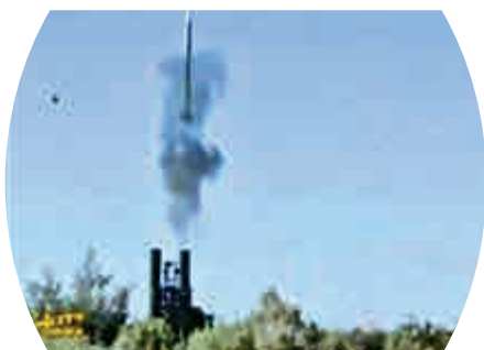
▲土庫曼軍演實彈射擊紅旗9導彈

FD-2000遠程防空導彈武器系統是中國自主研製的第三代防空導彈，2012年11月在第九屆珠海航展上首次亮相。2013年9月，FD-2000防空導彈在競標中擊敗俄歐產品，土耳其決定選擇購買12套FD-2000系統，作為下一代遠程防空系統，合同總金額達到34億美元，但由於美國等西方國家的壓力，以及土耳其自身的首鼠兩端，紅旗9出口土耳其的合同被擱置。此後人們紛紛猜測這種先進的導彈系統的首次出口會是哪個國家。