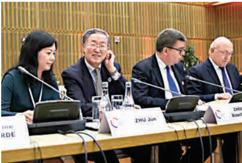
▲周小川（左二）表示，中國將於近期使用美元和特別提款權作為外匯儲備數據的報告貨幣

他還表示，當今世界，衝擊會很快地跨境傳導，同時全球經濟增長乏力、金融市場波動加劇，在這種情況下，需提高全球金融安全網的充足性和有效性。因此，應加強國際貨幣基金組織在全球金融安全網中的中心地位，並允許全球金融安全網中的其他要素例如區域安全網發揮補充作用。